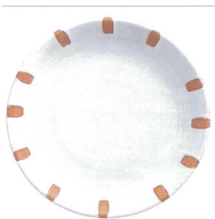
ソ406-41-2 刷毛目十草 9寸パスタ皿 (φ27×4cm) ¥2,800 1602383042 ソ406-42-2 刷毛目十草 7.0パスタ皿 (φ22.5×3.8cm) ¥1,800 1402386043