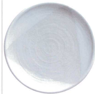
モ406-14-2 白志野 8.5皿 (φ25.7×3.8cm) ¥3,000 1227367023