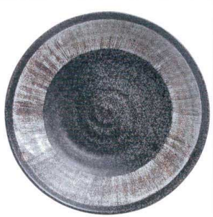
エ406-21-2 黒結晶白刷毛 麵鉢 (φ23×5cm) ¥2,800 2115397021