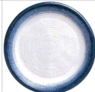
ス406-33-2 藍ぼかし 8.0皿 (φ24.5×2.5cm) ¥2,200 1826424041