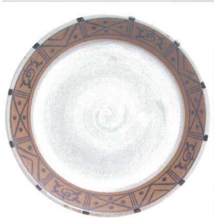
ワ406-31-2 南蛮間取 パスタ (φ27.2×4.2cm) ¥2,580 2109401033