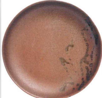
モ406-22-2 伊賀灰釉吹 9.0深皿 (φ28.3×4.5cm) ¥2,750 2124404014