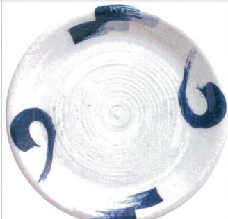
ス406-32-2 うず潮 8.0皿 (φ24.5×3cm) ¥2,500 1426387041