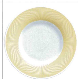
ル406-47-2 サンジェルマンイエロー 27cmプレート (φ27×3cm) ¥2,800 2205406047 ル406-48-2 サンジェルマンイエロー 25.5cmプレート (φ25.6×2.7cm) ¥2,200 2205406048