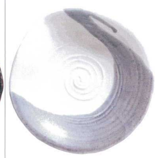
エ406-24-2 バイオレット 7.5浅鉢 (22.8×22.5×5.5cm) ¥2,600 2115397023