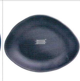
ケ406-34-2 ブラックビート ピラフ鉢 (26×20×4.5cm) ¥2,150 1830428024