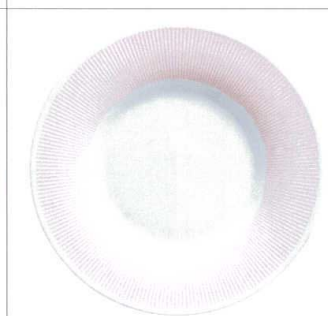
ル406-45-2 サンジェルマンピンク 27cmプレート (φ27×3cm) ¥2,800 2205406045 ル406-46-2 サンジェルマンピンク 25.5cmプレート (φ25.6×2.7cm) ¥2,200 2205406046