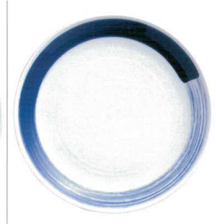
ヒ406-15-2 紺青 27cm丸皿 (φ27×3.5cm) ¥2,800 2017300010 ヒ406-16-2 紺青 25cm丸皿 (φ25×3cm) ¥2,450 2017300011