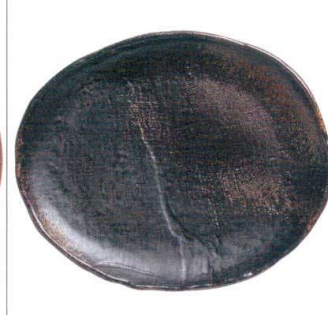
ヨ406-23-2 琥珀 10号小判皿 (29.5×24.3×4.3cm) ¥2,600 2228406023