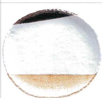
モ406-43-2 アメ塗分 パスタ皿 (25.8×23.3×2.9cm) ¥2,350 2124403042 モ406-44-2 アメ塗分 大皿 (23×20.5×2.1cm) ¥1,900 2124403043