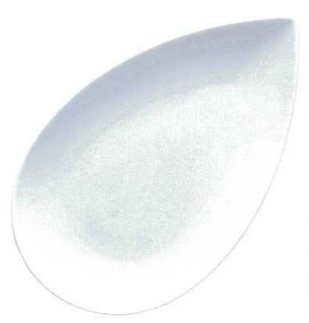
ツ406-11-2 タイド 34cm中長ティアプレート (34×21×3.7cm) ¥3,600 2021426026 ツ406-12-2 タイド 30cm中長ティアプレート (30.1×18.5×3.5cm) ¥2,800 2021426025