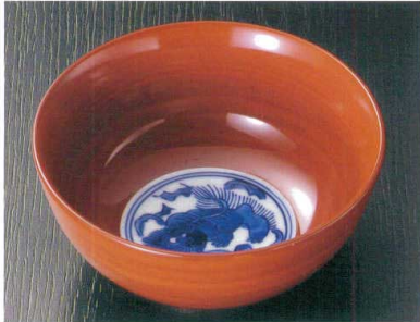
テ41-11-2 朱巻玉取獅子 中鉢 (φ12.3×5.6cm) ¥1,800 2211041011