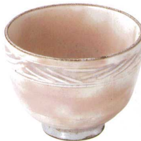
キ41-32-2 粉引 ソギ型小鉢 (φ11×8.8cm) ¥1,600 2113042051