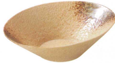
テ41-12-2 伊賀織部 石目5.3楕円鉢 (16.5×12.8×4.7cm) ¥1,750 2211041012