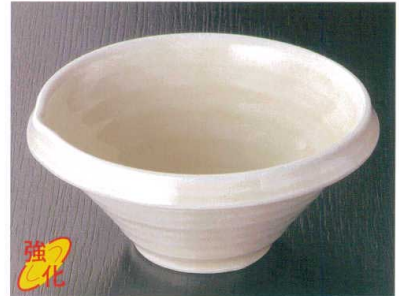
ウ41-13-2 黄白磁 片口小鉢 (13.5×13×6cm) ¥1,750 1601035041