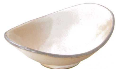
フ41-43-2 御本手双葉 中鉢 (14×10.5×4.8cm) ¥1,550 1809039041