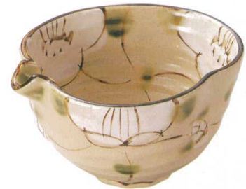
ソ41-24-2 格子花 片口4寸小鉢 (13.8×13×7cm) ¥1,630 1804039032