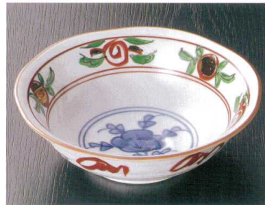
テ41-23-2 金丸紋 浅鉢 (φ14×4.5cm) ¥1,700 1222042036