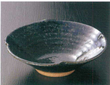
チ41-31-2 織部 中鉢(大) (φ16×4.5cm) ¥1,620 1208042051