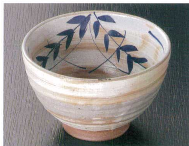
カ41-42-2 呉須巻内桔梗 深鉢 (φ11.8×7.3cm) ¥1,500 1214040033