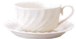
ヒ430-2-2 ティーカップ (φ9.2×5.6cm 190cc) ¥680 2022437012 ヒ430-3-2 受皿 (φ14.2×1.9cm) ¥500 2022437013