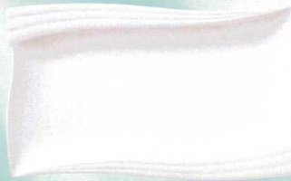
ヒ430-21-2 エンゼル長角皿(大) (30.5×18×3cm) ¥2,540 2117425021