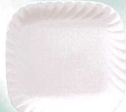
ヒ430-12-2 角パスタ (22.3×22.3×3.4cm) ¥1,780 2022437033