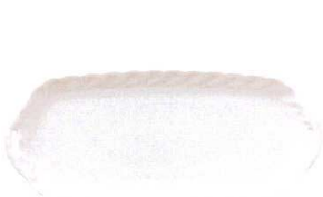
ヒ430-10-2 サービストレイ(小) (24.8×10.6×1.9cm) ¥1,550 2022437037