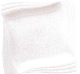
ヒ430-22-2 エンゼル四方角皿(小) (15×15×1.5cm) ¥920 2022437026 ヒ430-23-2 エンゼル四方角皿(中) (19.3×19.3×2cm) ¥1,730 2022437001 ヒ430-24-2 エンゼル四方角皿(大) (24.5×24.5×2.5cm) ¥2,540 2022437027