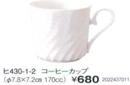
ヒ430-1-2 コーヒーカップ (φ7.8×7.2cm 170cc) ¥680 2022437011