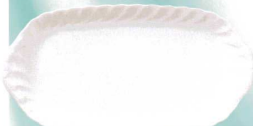
ヒ430-11-2 サービストレイ(大) (30×15.8×2.6cm) ¥2,880 2022437036