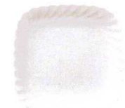
ヒ430-13-2 角プチケーキ (14.6×14.6×2cm) ¥700 2022437032