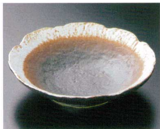
セ44-31-2 夜明け 5.0浅鉢 (φ16×4.9cm) ¥920 1832042024