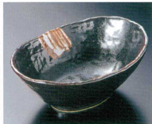
ケ44-14-2 白刷毛目唐津石目 楕円鉢(中) (17×12.5×6.5cm) ¥980 2030037021