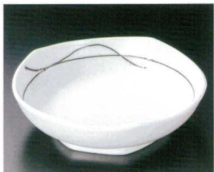
子44-11-2 絆 50鉢 (φ15.8×4.5cm) ¥1,000 2108035053