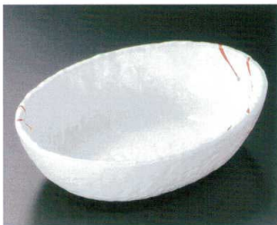
セ44-12-2 紅万葉 5.5小判鉢 (17.2×13×4.8cm) ¥990 1832042011