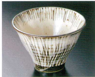
ウ44-41-2 刷毛目十草 反深鉢 (φ12.5×8cm) ¥860 2201044041