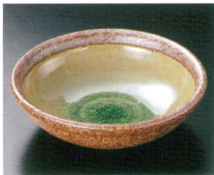
ヨ44-32-2 南蛮ビードロ 小鉢 (φ14.5×4.5cm) ¥920 2228044032