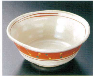
キ44-44-2 朱巻点紋 三角鉢 (φ15×6.2cm) ¥850 2013028031