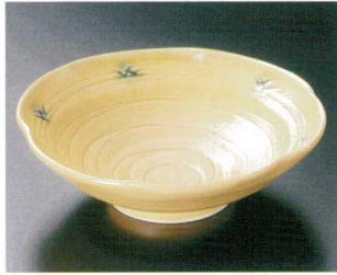
モ44-52-2 黄瀬戸草紋 花型平鉢 (φ13.7×4cm) ¥840 2124036013