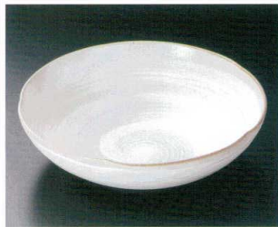
ミ44-33-2 京唐津 平鉢 (φ16×4.7cm) ¥900 2123035052