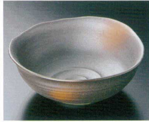
ト44-53-2 備前 手造り小鉢(中) (15.5×15×11cm) ¥820 2216044053 ト44-54-2 備前 手造り小鉢(小) (13×12.3×12cm) ¥780 2216044054