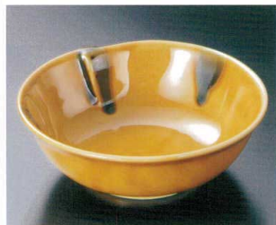
ツ44-24-2 黄瀬戸 中鉢 (φ15.8×5.5cm) ¥930 2121035033