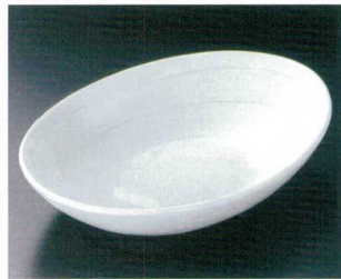
セ44-34-2 やよい 楕円鉢 (17×12.5×3.9cm) ¥880 1832042024