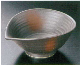
ワ44-42-2 黒伊賀 ねじり鉢(大) (15.1×12.6×6.3cm) ¥860 2009036044