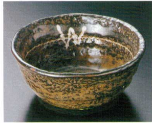
ワ44-51-2 岩肌 中鉢 (12.8×5.5cm) ¥850 1809057016