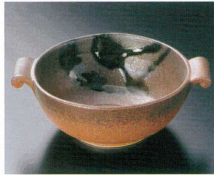
モ44-43-2 伊賀灰釉吹 耳付中鉢 (15.5×12.7×5.7cm) ¥850 2124036014