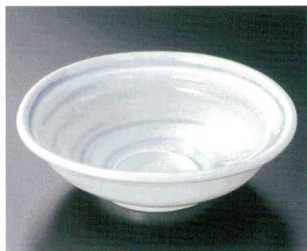
ウ44-23-2 かれん 煮物鉢 (φ16×15.5×4.8cm) ¥950 2201044023