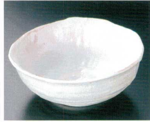
ト44-55-2 桜志野 手造り鉢 (15.5×15×11cm) ¥820 2216044055