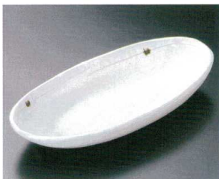
ス44-22-2 粉引点彩 舟型中皿 (21.7×10.3cm) ¥950 2026125053