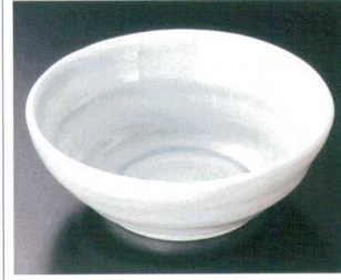
ウ45-34-2 かれん 4.5鉢 (φ13.7×5cm) ¥680 2201045034