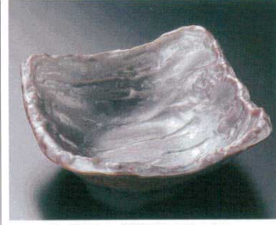
ヤ45-15-2 銀河荒ソギ小鉢 (14×14×5cm) ¥750 2110036022