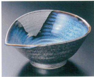
ト45-11-2 清流 ねじり小鉢(大) (15×13×6cm) ¥840 2216045011 ト45-12-2 清流 ねじり小鉢(小) (11×8.5×5cm) ¥450 2216045012