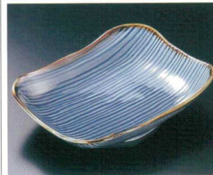
リ45-52-2 測鏡呉須千段 四方鉢 (15.8×12×3.5cm) ¥470 1829043053