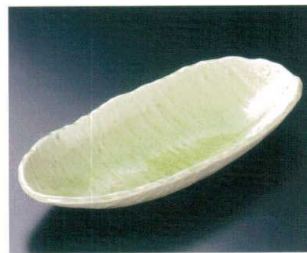
ス45-41-2 ひわ 楕円中鉢 (21.5×10×3cm) ¥650 2026125054