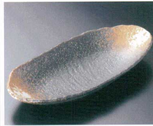
ス45-32-2 吹黒備前 舟型小鉢 (22×10.2×3cm) ¥700 2126036033