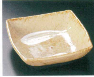
モ45-14-2 黄灰釉 正角中鉢 (15.2×15.2×4cm) ¥770 2124036021