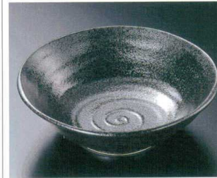
エ45-53-2 鳴門黒耀 煮物鉢 (φ16.7×5.2cm) ¥460 2215045053