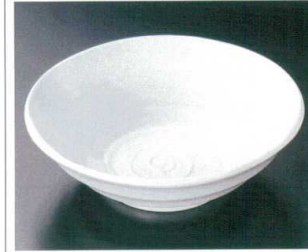
エ45-54-2 鳴門白 煮物鉢 (φ16.7×5.2cm) ¥400 2215045054