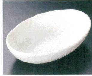
ト45-23-2 粉引 夕円小鉢 (16×10.8×4.3cm) ¥740 2016049014