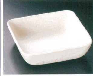
ウ45-24-2 白荒土 切立中鉢 (14×14×4cm) ¥730 2101036012