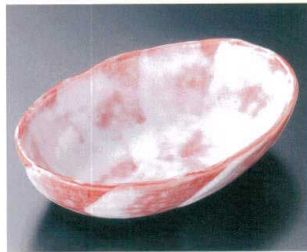
ト45-21-2 赤彩花 夕円小鉢 (16×21×4cm) ¥750 2216045021