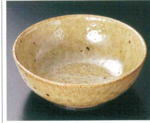
モ45-44-2 黄唐津 4.0ボール (φ13.1×4.7cm) ¥580 2024051054