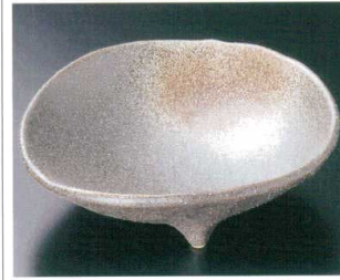
テ45-43-2 黒伊賀 三つ足向付 (14.5×14×4.5cm) ¥600 1611032033