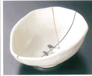
ワ45-33-2 乱線 変形小鉢 (15×11.5×5.8cm) ¥700 2009036043