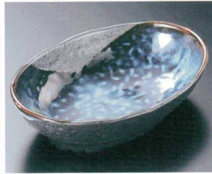
ト45-22-2 清流 夕円小鉢 (15.5×10.5×4cm) ¥750 1616059052