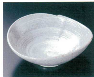
ウ45-51-2 青地刷毛 中鉢 (14.5×14.5×5.3cm) ¥580 2101012051