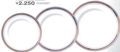
ト452-14-2 6½吋パン皿 (16.5cm) ¥1,350 1816445021 ト452-15-2 7½吋ケーキ皿 (19.1cm) ¥1,600 1816445022 ト452-16-2 8吋デザート皿 (20.9cm) ¥1,920 1816445023