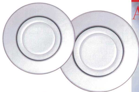
ツ452-21-2 27cmラウンドインプレート (φ27.2×3.2cm) ¥2,900 2121436031 ツ452-22-2 24cmラウンドインプレート (φ23.8×3cm) ¥1,900 2121436032