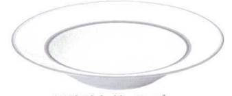
ツ452-40-2 30cmスープ (φ29.5×5.4cm) ¥5,150 2121436050