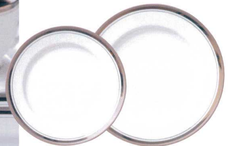
ト452-17-2 9吋ミート皿 (23.2cm) ¥2,200 1816445024 ト452-18-2 10吋ディナー皿 (27.7cm) ¥3,450 1816445025 ト452-19-2 12吋プレート (30.5cm) ¥6,000 1816445026