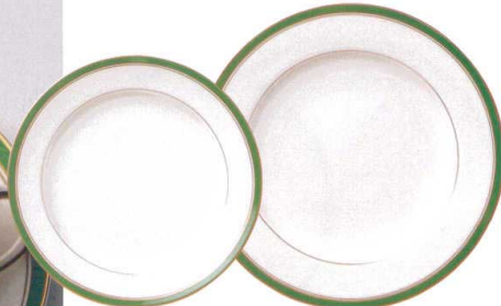
ト454-18-2 9吋ミート (φ23cm) ¥2,250 1416424034 ト454-19-2 10吋ミート (φ27cm) ¥3,800 1416424035 ト454-20-2 12吋ミート (φ30.2cm) ¥6,100 1416424036