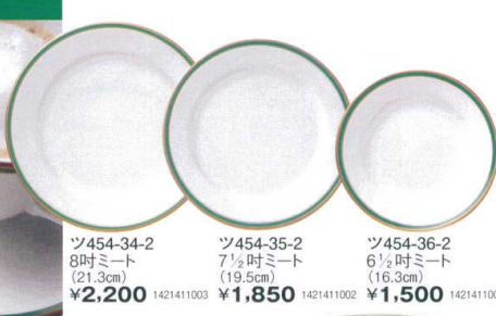
ツ454-34-2 8吋ミート (21.3cm) ¥2,200 1421411003 ツ454-35-2 7½吋ミート (19.5cm) ¥1,850 1421411002 ツ454-36-2 6½吋ミート (16.3cm) ¥1,500 1421411001