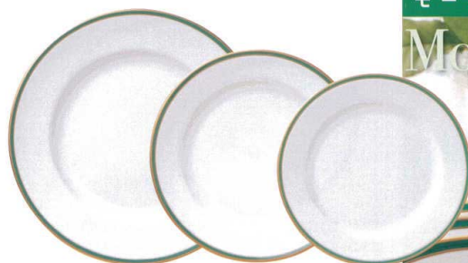
ツ454-31-2 12吋ミート (30.5cm) ¥7,500 1421411006 ツ454-32-2 10吋ミート (26cm) ¥3,400 1421411005 ツ454-33-2 9吋ミート (23.3cm) ¥2,300 1421411004