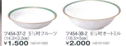
ツ454-37-2 5½吋フルーツ (14.3×3.3cm) ¥1,500 1421411020 ツ454-38-2 6½吋オートミル (16.5×5cm) ¥2,000 1421411007