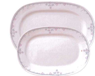
ト459-21-2 12吋プラター (30.5×20.5×2.8cm) 30入 ¥3,750 2016478052