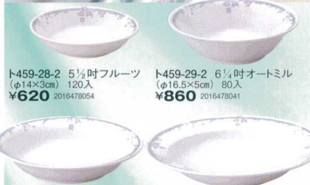
ト459-28-2 5½吋フルーツ (φ14×3cm) 120入 ¥620 2016478054