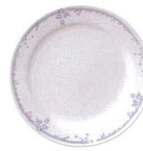
ト459-32-2 7½吋ミート (φ20×2cm) 60入 ¥870 2016478043