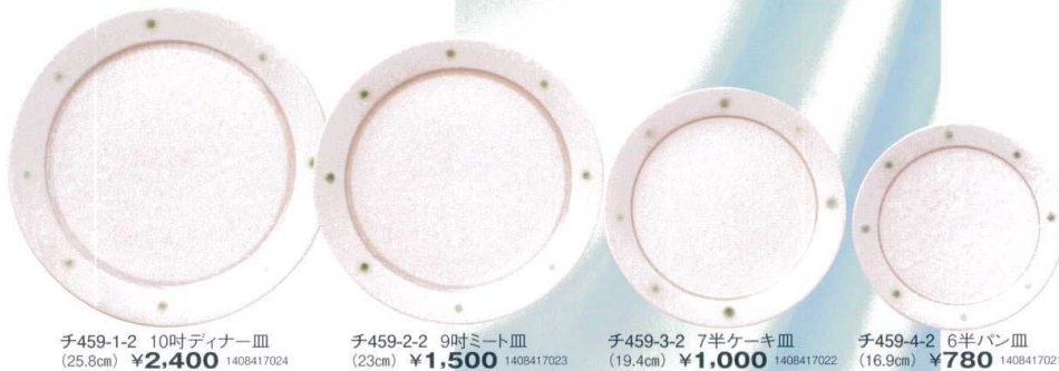
チ459-1-2 10吋ディナー皿 (25.8cm) ¥2,400 1408417024