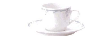
ト459-23-2 コーヒーC/S (φ15.3×2cm) 6入 ¥1,750 2016478048