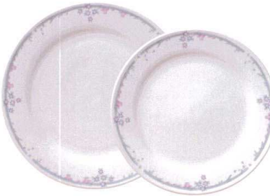
ト459-26-2 10吋ミート (φ26×2.3cm) 40入 ¥1,650 2016478045