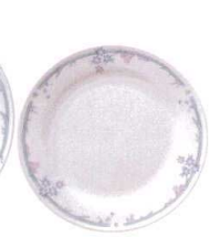
ト459-33-2 6½吋ミート (φ16.7×1.8cm) 120入 ¥620 2016478042