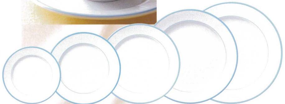
ト460-32-2 6 1/2吋パン皿 (φ16.5×2.1cm) ¥960 1616425005