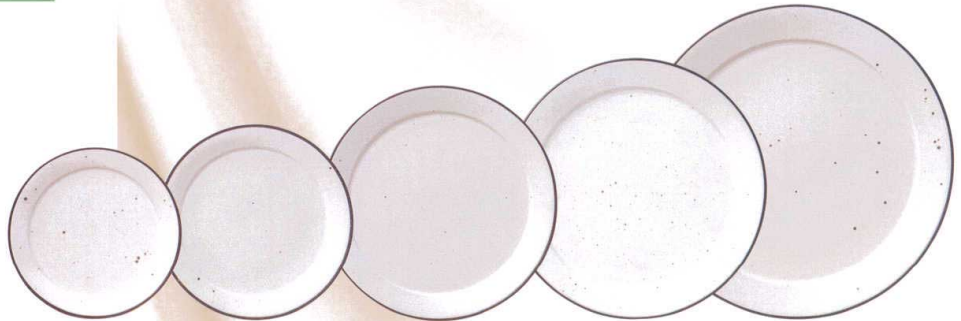
ワ460-4-2 6 1/2吋ミート (φ16.7cm) ¥620 1209397031