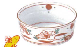
ウ47-42-2 赤絵万層六兵工 小鉢 (φ12.2×5.8cm) ¥2,350 1601036032