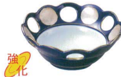
ケ47-23-2 波型六ツ透 4.5小鉢 (φ13.5×5.5cm) ¥2,500 1430047033