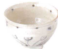
ツ47-53-2 安南揺落草花文 小鉢 (φ10.5×7.8cm) ¥2,300 2121039012