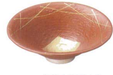
工47-14-2 朱巻金彩 反小鉢 (φ13.7×4.5cm) ¥2,700 1415045021