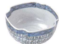
リ47-64-2 木甲型染付漢詩入 小鉢 (φ11.2×6cm) ¥2,300 1429039021