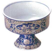
ケ47-11-2 銀彩唐草紋 小鉢 (φ10×8cm) ¥2,900 1430045011