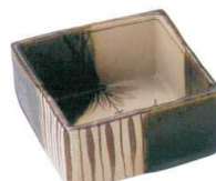
モ47-63-2 織部つる花 角小鉢 (10×10×4.8cm) ¥2,700 1624040011