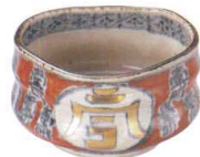
ソ47-51-2 文字入赤濃 小鉢 (10.5×9.8×6cm) ¥2,350 1404044011