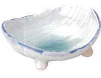
ト47-61-2 灰青磁測り流し 夕円小鉢(手造り) (13×12×4.5cm) ¥2,400 2016039031