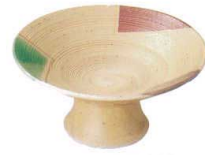
リ47-13-2 三彩 高台小鉢 (φ12.2×5.8cm) ¥2,250 1429047013