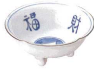
マ47-22-2 喜貴福財 三ツ足小鉢 (φ11.6×5cm) ¥2,500 1207045043