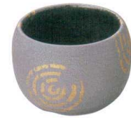
キ47-24-2 いぶし金彩 丸小鉢 (φ10.5×7.5cm) ¥2,800 2113038013