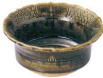
ツ47-21-2 織部輪花 反小鉢 (φ12.8×6cm) ¥2,650 1421038021