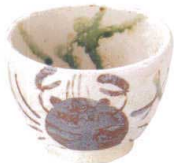
ヤ47-31-2 志野織部カニ 深湯呑 (φ10.5×7.5cm) ¥2,400 1410044021