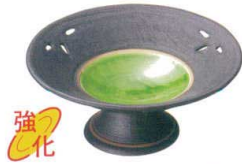
ケ47-12-2 鉄砂世透し緑交趾 高台小鉢 (φ13.5×5.8cm) ¥2,480 1630044042