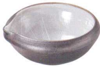
マ47-41-2 粉引片口鉢 (13×12×4.6cm) ¥2,500 1607044022