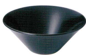
ハ490-13-2 黒マット 6.8切立井 (φ20.3×8cm) ¥2,200 2006534036