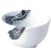
ハ490-35-2 黒三龍 4.0井 (φ12.5×7cm 450cc) ¥1,100 2206490035