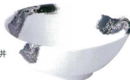
ハ490-34-2 黒三龍 6.3リム腰井 (φ18.7×7.7cm 980cc) ¥2,000 2206490034