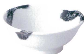
ハ490-33-2 黒三龍 6.8反高台井 (φ20.3×8.2cm 1,200cc) ¥2,000 2206490033