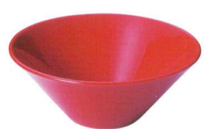
ハ490-14-2 朱赤 6.8切立井 (φ20.3×8cm) ¥3,100 2006534034