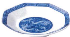
ワ490-41-2 昇龍 八角シューマイ (19.2×18.7×3.6cm) ¥700 2209490041