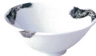
ハ490-31-2 黒三龍 7.5新反深井 (φ22.5×9.2cm 1,450cc) ¥2,500 2206490031