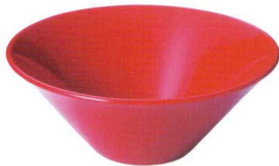
ハ490-12-2 朱赤 7.5切立井 (φ22×8.6cm) ¥3,400 2006534033