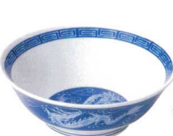
ワ490-47-2 昇龍 6.3ラーメン (φ19.3×7.2cm) ¥740 2209490047