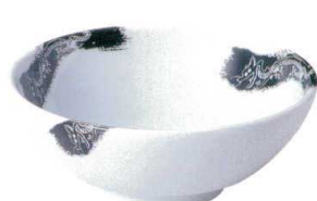
ハ490-32-2 黒三龍 6.8リム腰井 (φ20.7×8.1cm 1,300cc) ¥2,200 2206490032