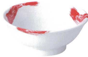
ハ490-23-2 赤三龍 6.8反高台井 (φ20.3×8.2cm 1,200cc) ¥2,000 2206490023