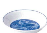
ワ490-44-2 昇龍 4.0フルーツ皿 (φ14.2×3.3cm) ¥330 2209490044