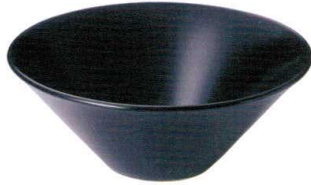
ハ490-11-2 黒マット 7.5切立井 (φ22×8.6cm) ¥2,600 2006534035