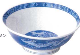
ワ490-46-2 昇龍 6.8ラーメン (φ21.4×8.8cm) ¥1,000 2209490046