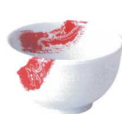
ハ490-25-2 赤三龍 4.0井 (φ12.5×7cm 450cc) ¥1,100 2206490025