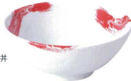
ハ490-24-2 赤三龍 6.3リム腰井 (φ18.7×7.7cm 980cc) ¥2,000 2206490024