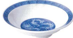
ワ490-42-2 昇龍 6.0丸高台皿 (φ18.7×5.4cm) ¥630 2209490042