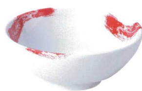
ハ490-22-2 赤三龍 6.8リム腰井 (φ20.7×8.1cm 1,300cc) ¥2,200 2206490022