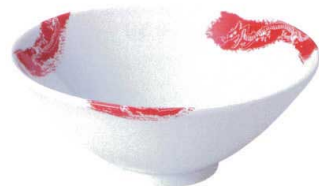
ハ490-21-2 赤三龍 7.5新反深井 (φ22.5×9.2cm 1,450cc) ¥2,500 2206490021