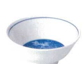
ワ490-45-2 昇龍 3.6汁椀 (φ12×5.5cm) ¥400 2209490045