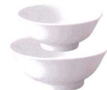
ニ505-17-2 高台5.8丼 (φ17.7×7.4cm) ¥650 2003521007 ニ505-18-2 高台6.3丼 (φ19.1×7.7cm) ¥730 2003521008 ニ505-19-2 高台6.5丼 (φ20.3×8.5cm) ¥780 2003521009 ニ505-20-2 高台6.8丼 (φ21.3×8.5cm) ¥880 2003521010