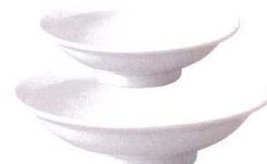
ニ505-6-2 6.0丸高台皿 (φ18.9×4.5cm) ¥650 2003521014 ニ505-7-2 7.0丸高台皿 (φ21.9×6.4cm) ¥830 2003521015 ニ505-8-2 8.0丸高台皿 (φ24.5×7cm) ¥1,800 2003521016