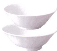
ニ505-15-2 切立6.3丼 (φ19.7×6.8cm) ¥500 2003521011 ニ505-16-2 切立6.5丼 (φ20.5×7.6cm) ¥750 2003521012