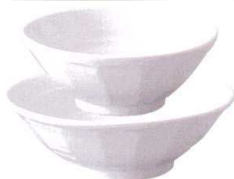
ニ505-13-2 けずり6.8丼 (φ20.8×8.4cm) ¥1,000 2003521002 ニ505-14-2 けずり8.0丼 (φ24.3×6.3cm) ¥2,400 2003521001