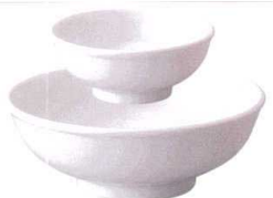
ニ505-9-2 5.0玉丼 (φ15.7×6.5cm) ¥680 2003521003 ニ505-10-2 6.5玉丼 (φ19.6×7.5cm) ¥1,100 2003521004 ニ505-11-2 7.0玉丼 (φ21.8×8cm) ¥1,700 2003521005 ニ505-12-2 8.0玉丼 (φ25×9.4cm) ¥2,800 2003521006