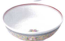
ウ514-8-2 6.5玉井 (φ19.7×7.5cm) ¥2,150 1202452003