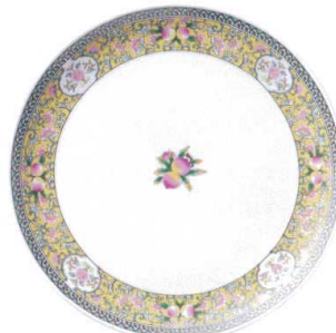
ウ514-5-2 4.0皿 (φ13.2cm) ¥700 1202452015