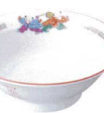
ウ514-45-2 7.0丸高台皿 (φ22×6.4cm) ¥1,200 1601490031