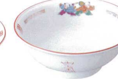
ウ514-46-2 切立6.3井 (φ19.6×6.8cm) ¥750 1601490032