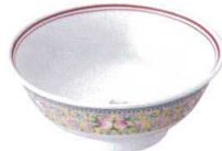
ウ514-10-2 高台6.8井 (φ21×8.5cm) ¥1,680 1202452007