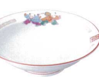
ウ514-43-2 丸3.0皿 (φ9.2cm) ¥360 1601490039