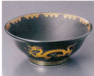
ニ518-22-2 黒釉金竜 6.8高台丼 (φ21.2×8.3cm) ¥1,780 2103488031 ニ518-23-2 黒釉金竜 6.3高台丼 (φ18.7×7.8cm) ¥1,360 2103488032