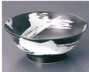
リ518-42-2 黒檀 7.0反丼 (φ21.7×9cm) ¥1,250 2129488041