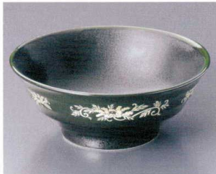
ニ518-21-2 グリーン志野金牡丹 6.8大名丼 (φ21.4×8.8cm) ¥1,930 1803532049