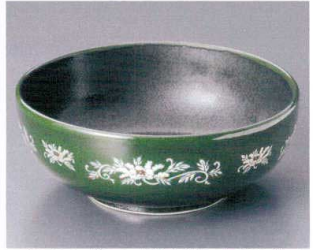
ニ518-17-2 グリーン志野金牡丹 京風7.0ボール (φ21.7×8.8cm) ¥2,500 1803533014