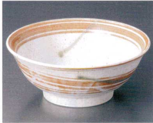
ソ518-31-2 ひすい 6.8高台丼 (φ21.2×8.6cm) ¥1,400 2104489053