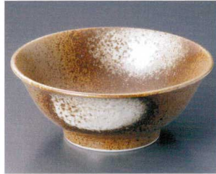
リ518-32-2 砂丘 7.0反丼 (φ21.7×9cm) ¥1,380 2129488051