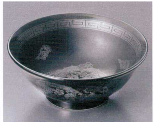
ニ518-44-2 黒釉銀竜紋 高台6.8丼 (φ21.3×8.3cm) ¥1,450 2003534053