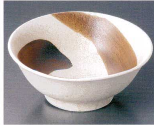
リ518-33-2 黄砂 7.0反丼 (φ21.2×8.5cm) ¥1,380 2029533052