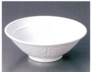
フ518-54-2 白ホルル 6.3反丼 (φ19.3×6.7cm) ¥850 2209518054