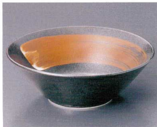
リ518-51-2 黒潮 6.3切立丼 (φ19.5×7cm) ¥950 2029533053