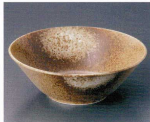
リ518-53-2 砂丘 6.3切立丼 (φ19.5×7cm) ¥950 2129490052