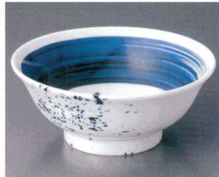
リ518-43-2 海流 7.0反丼 (φ21.7×9cm) ¥1,250 2129488043