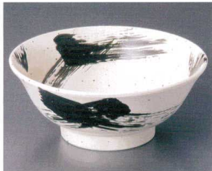
リ518-41-2 白檀 7.0反丼 (φ21.7×9cm) ¥1,250 2129488042