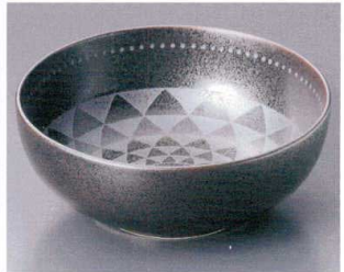
ニ518-25-2 銀彩ウロコ紋 京風7.0ボール (φ21.7×8.6cm) ¥1,850 1203455044 ニ518-26-2 銀彩ウロコ紋 京風6.5ボール (φ19.7×7.5cm) ¥1,100 1203455043