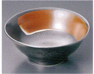
リ518-34-2 黒潮 7.0反丼 (φ21.2×8.5cm) ¥1,380 2029533051