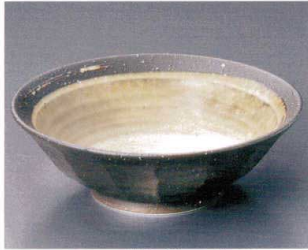
ハ518-11-2 粹波 削り8.0丼 (φ24.5×8.5cm) ¥3,100 2206518011 ハ518-12-2 粹波 削り6.8丼 (φ20.5×8.3cm) ¥1,900 2206518012