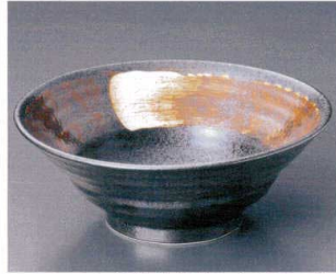
ソ518-15-2 黒結晶白刷毛 六兵衛8.0丼 (φ25×9.4cm) ¥2,400 2104487051 ソ518-16-2 黒結晶白刷毛 六兵衛7.0丼 (φ22.5×8.8cm) ¥1,900 2104487052