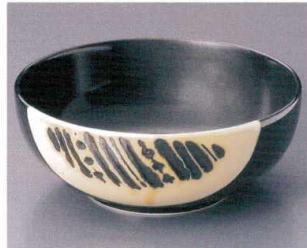
ニ518-24-2 引出黒 京風7.0ボール (φ21.8×8.6cm) ¥1,750 1403492024