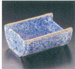
セ53-25-2 刷金吹墨 竹割小鉢 (11.6×8.7×4.5cm) ¥1,200 1832055051