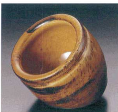
ヒ53-51-2 胎 たこ壺(大) (φ10.5×11.3cm) ¥1,200 2217053051 ヒ53-52-2 胎 たこ壺(中) (φ7.7×8cm) ¥800 2217053052 ヒ53-53-2 胎 たこ壺(小) (φ5.7×6cm) ¥500 2217053053