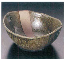
セ53-54-2 織部三角紋 中鉢 (15.6×13.2×7cm) ¥1,150 2132034043 セ53-55-2 織部三角紋 小鉢 (12.3×10×5.2cm) ¥640 2132048052