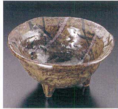
フ53-13-2 灰釉格子 小鉢 (12.8×12.5×6cm) ¥1,200 1204048055