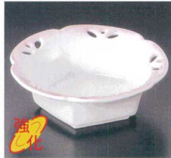
モ53-23-2 ピンク吹 スカン松花堂 (φ11.4×3.7cm) ¥1,250 2224053023