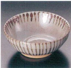
リ53-41-2 粉引錆十草 丸鉢 (φ11×4.5cm) ¥1,170 1429056022