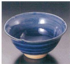
ル53-32-2 藍染灰釉流し 4.0鉢 (φ12.5×6cm) ¥1,200 1205052051