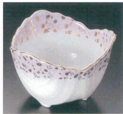
キ53-35-2 紫吹金箔 三ツ葉形小鉢(大) (10.8×7.4cm) ¥1,150 2013054413(中国産)