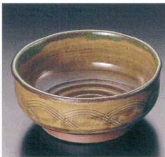
エ53-31-2 灰釉織部流し 梅型4.0井 (φ12.5×5.4cm) ¥1,200 2215053031