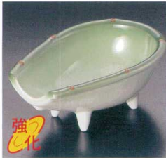
セ53-21-2 緑彩 箕型小鉢 (12×8.5×4.9cm) 100入 ¥1,250 2032045025