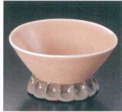
フ53-15-2 ピンク貫入 高台鉢 (φ11.5×6.5cm) ¥1,220 2209053015