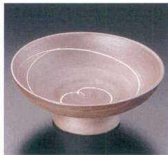
リ53-33-2 南蛮ウズ 高台皿 (φ12.8×5cm) ¥1,200 1429042032