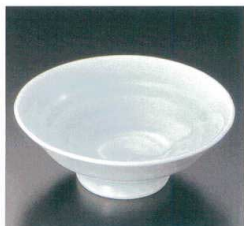
カ53-59-2 青白磁うず 平鉢 (φ12.8×4.6cm) ¥1,100 1414056013