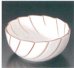
ツ53-45-2 赤ネチリトクサ 3.0浅小鉢 (φ9×4cm) ¥1,100 1821067024