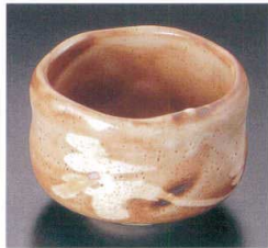
ツ53-43-2 赤志野 抹茶小鉢 (φ9.3×6.5cm) ¥1,200 1821055035