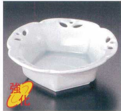
モ53-22-2 青白磁 スカン松花堂 (φ11.4×3.7cm) ¥1,250 2224053022