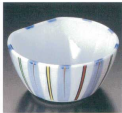
ツ53-34-2 古染半月十草 小鉢 (11.4×10.5×5.5cm) ¥1,200 1821062015