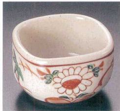
ツ53-42-2 赤画灰釉 小付 (8×8×5cm) ¥1,100 1221064052