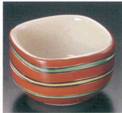
ツ53-44-2 灰釉干段三色 小付 (8×8×5cm) ¥1,100 1221063012