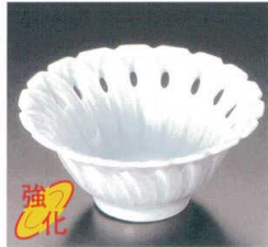
モ53-24-2 青白磁 かごめ3.6小鉢 (φ11×4.9cm) ¥1,200 2224053024