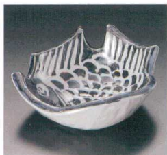
キ53-58-2 特選美濃古染 魚 小鉢 (12×11×4.8cm) ¥1,150 2022275026