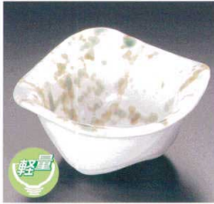
フ53-11-2 「軽量」夢幻 変型4.5鉢 (12.6×12.3×5.6cm) ¥1,240 2109044023