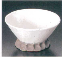
フ53-14-2 白斑点 高台鉢 (φ11.5×6.5cm) ¥1,220 2209053014