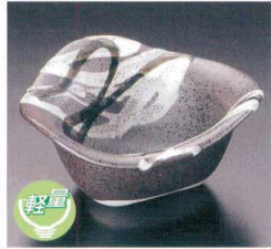
フ53-12-2 「軽量」黒釉乱線 変型4.5鉢 (12.6×12.3×5.6cm) ¥1,240 2109044024