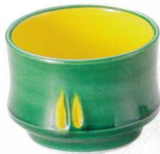
N66-32-2 竹割交趾 中付 (φ8×5.8cm) ¥1,980 1201064011