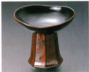
W66-11-2 黒釉 高浜小鉢 (11×9.3×9.5cm) ¥2,100 2209066011