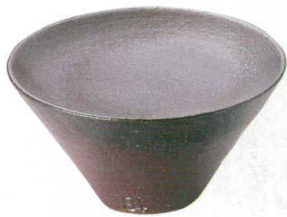
W66-41-2 炭化 スタンドプレート浅(S) (φ11×6cm) ¥1,880 2209066041