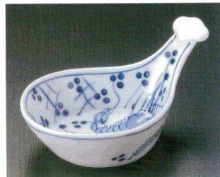
T66-31-2 古染エビピワ形小付 (12.5×8.4×5.8cm) ¥2,000 1222063043