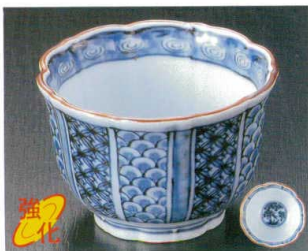
M66-51-2 平安花鳥 3.0珍味 (φ9×6cm) ¥1,700 2024064016