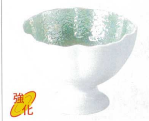
S66-43-2 真珠ラスターヒワ吹 高台小付 (φ8.5×6.5cm) ¥1,710 2232066043