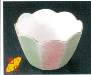
T66-33-2 ハツ山ピンク 小付 (φ8.8×5.5cm) ¥1,900 1408065011