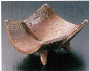
K66-22-2 手造り灰吹きトジメ 小付 (10.5×9×5.5cm) ¥2,200 1213064045