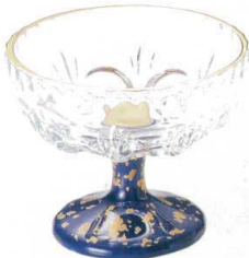
K66-21-2 ガラスソール 小鉢 (8.8×7cm) ¥2,250 1630062041