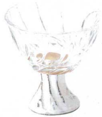
L66-12-2 粉引 ガラス高台鉢 (φ19.2×9.2cm) ¥2,900 2205066012