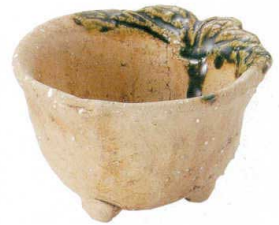
M66-14-2 手造り伊賀風かぶら 小付 (φ10×6cm) ¥2,950 1224063011