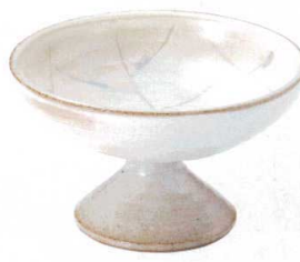
K66-23-2 粉引木の葉 高台小鉢 (φ10.3×6cm) ¥2,500 1813048011