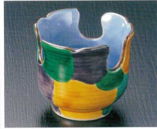
T66-13-2 三彩 ミツ切小付 (φ7×6cm) ¥2,600 1221062032