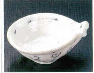
T66-44-2 安南揺落草花文 豆香水 (10.3×8.5×4cm) ¥1,700 2121057035