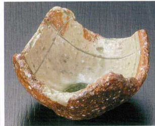
T66-42-2 伊賀灰釉 四方立小鉢(手造り) (φ9.5×5.5cm) ¥1,700 2016059014