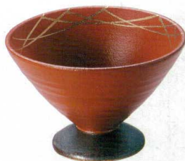
K66-53-2 赤化粧金ライン 3.3小付 (φ9.7×6.3cm) ¥1,850 1430062032