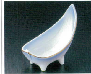
N66-55-2 潤金コバルト 笹型小付 (12.5×6.7×10.3cm) ¥1,550 2004059033