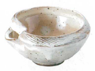
W66-56-2 粉引梅目 片口小付 (10×9.5×5cm) ¥1,550 2109057041