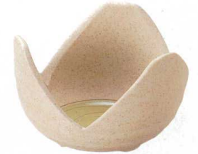
K66-34-2 もえぎ焼 珍味 (φ8×5cm) ¥1,900 1430066053