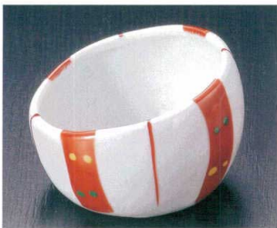
マ67-31-2 点十草 小鉢 (φ8.3×5.5cm) ¥1,200 1607063034