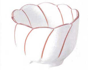
ツ67-32-2 ネジリ赤十草 小付 (φ7.3×5.5cm) ¥1,200 1421063032