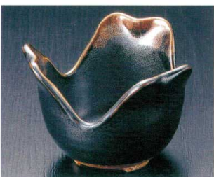
モ67-51-2 金彩黒結晶 三ツ山小鉢 (φ9.5×6.4cm) ¥1,000 1818057046