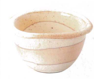
ワ67-43-2 萩十草 曲がり小付 (9.5×8.5×5.3cm) ¥1,080 2209067043