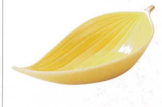
テ67-54-2 黄釉 笹舟小付 (15.2×5.8×3cm) ¥900 2211067054