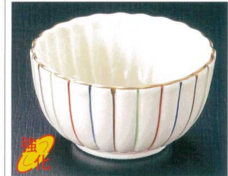
モ67-24-2 赤絵十草 菊型2.8小付 (φ8×4.3cm) ¥1,250 2224067024