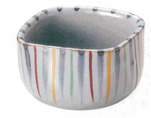
ツ67-52-2 粉引色入十草 小付 (7.5×7.5×4.8cm) ¥950 1421064025