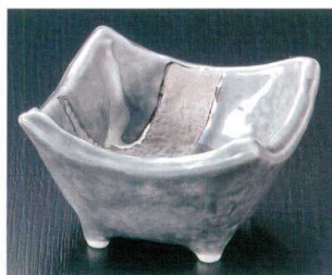
ス67-53-2 ねずみ銀彩 角3.5小鉢 (8.3×8.3×5cm) ¥950 2026060023