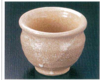
リ67-44-2 白志野 ツボ型小付 (φ7.3×6cm) ¥1,050 1429064046