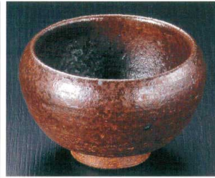
キ67-13-2 灰吹き 小付 (φ9.5×5.8cm) ¥1,480 1213064014