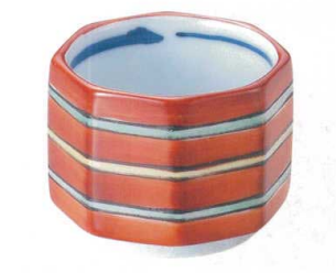
ツ67-41-2 朱染千段 八角小付 (φ7×5.4cm) ¥1,100 1221064021