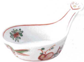
テ67-12-2 赤絵 ビワ型小付 (12.1×8.5×6.2cm) ¥1,480 1422063043