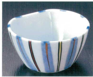
ツ67-42-2 古染半月十草 小付 (9.3×8.7×5cm) ¥1,100 1821062016