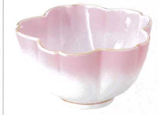
リ67-34-2 測金ピンク 桜型小付 (φ9×5cm) ¥1,150 1429064035