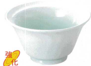
ハ67-14-2 錦さの 波深珍珠 (φ8.7×6.7cm) ¥1,350 1206212012