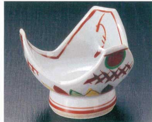
キ67-22-2 赤絵 割山椒(中) (8.5×8.5×6.6cm) ¥1,350 1213211021