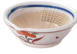
マ67-23-2 古代花 すり小鉢 (10×9.7×3.8cm) ¥1,300 1807071032