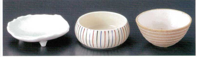
ソ68-44-2 ヒワ青磁 ちぎり丸小付 (10×9.6×2.4cm) ¥640 2004170044