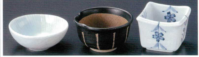
リ68-54-2 青白磁六兵衛 トチリ小鉢 (φ9.5×4.3cm) ¥520 2129059065