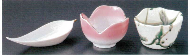
ソ68-14-2 白磁笹舟 小付 (15.2×5.8×3cm) ¥800 1822075022