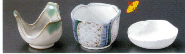
チ68-51-2 ヒワ ミツ山小付 (8×6cm) ¥580 1808069025