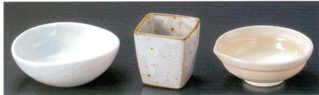
リ68-21-2 青白 まゆ型小付 (11×10×4cm) ¥750 1429056042