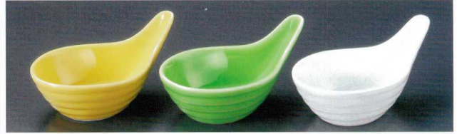
モ68-34-2 黄 ヒワ型小鉢 (11.7×7.3×5.2cm) ¥670 2224068034