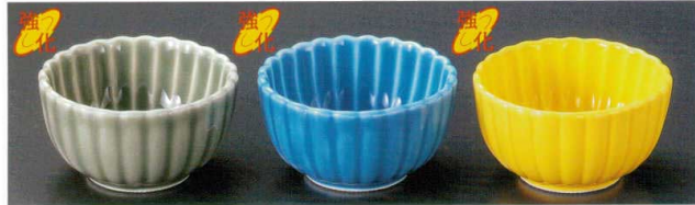
モ68-11-2 織部 菊型2.6小鉢 (φ7.8×4.3cm) ¥840 1227065064