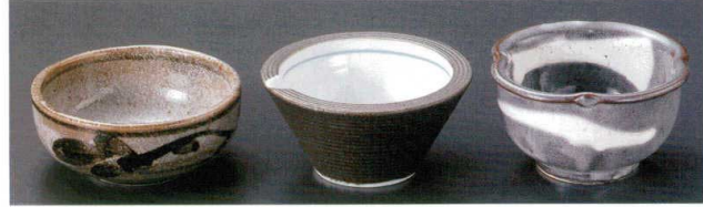
ハ68-41-2 唐津唐草 平鉢3.0ボール (φ9.5×4cm) ¥660 2206068041