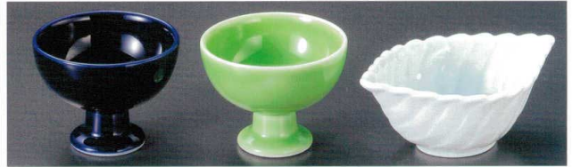
モ68-24-2 ルリ 高台小付 (φ7.8×6cm) ¥690 2124059025