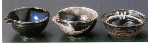
ト68-61-2 清流 片口ミニ鉢 (10×9×5cm) ¥540 1816168211