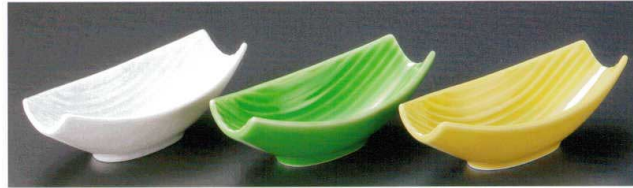
モ68-31-2 白 笹型小付 (13.7×6.6×4.2cm) ¥670 2224068031