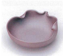
ケ78-31-2 南蛮瓢 小鉢 (11.3×10.3×3.4cm) ¥1,250 1430077034