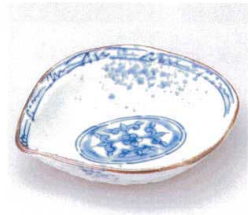
リ78-32-2 吹き墨 あわび型小皿 (12.8×10.8×2.6cm) ¥1,200 1629075044