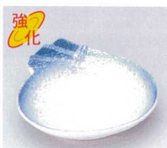
セ78-41-2 ブルーラスター 袋型松花堂 (11.3×11.2×3.6cm) ¥1,200 2132071011