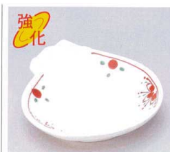
モ78-25-2 赤絵小花 袋型松花堂 (11.3×11.2×3.6cm) ¥1,350 2224078025