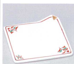
ツ78-44-2 赤絵 角折皿 (11.2×11.2×2.5cm) ¥950 1621078033