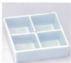
ツ78-24-2 青地 四ツ切仕切角鉢 (11.2×11.2×3.3cm) ¥1,150 1221076059