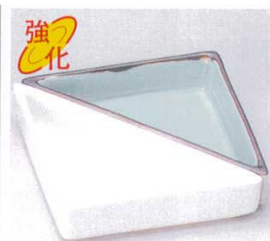
セ78-22-2 クリーム 三角松花堂 (10.8×10.8×15.2×2.7cm) ¥640 1832078014 セ78-23-2 トルコ貴入 松花堂 (10.8×10.8×15.2×2.7cm) ¥640 1832078013