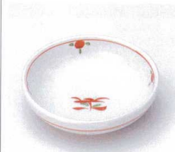
マ78-34-2 赤絵花 丸鉢 (φ10.5×3cm) ¥1,200 2007072022