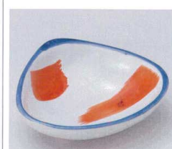
リ78-45-2 朱ハケメ 貝型小鉢 (12.5×11×4cm) ¥1,060 1429056021