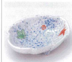
マ78-35-2 吹き墨もみじ 葉型 (13.3×9.6×3.5cm) ¥1,200 1807081012