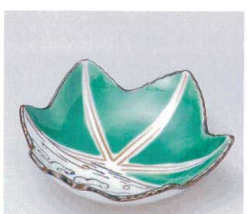
リ78-43-2 緑交趾静海汲 楓型皿 (11.8×11.8×3.5cm) ¥1,250 1629075021