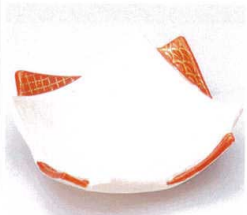
セ78-33-2 赤絵 重ね型皿(小) (11×11×3.6cm) 80入 ¥1,250 2032076016