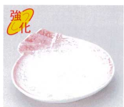
セ78-42-2 ピンクラスター 袋型松花堂 (11.3×11.2×3.6cm) ¥1,200 2132069041