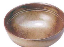
ケ79-23-2 南蛮吹二本線 丸小鉢 (φ11×4.2cm) ¥1,500 1430072043