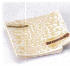
ワ79-51-2 イラボ 瓦型皿 (10.3×10.3×1.8cm) ¥640 2209079051