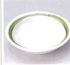
エ79-44-2 白マツ浏金グリン 松華堂 (11.5×11×2.7cm) ¥1,200 1415072031