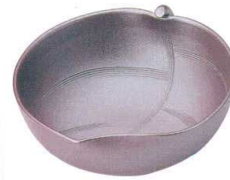
ケ79-111-2 南蛮 葉型小鉢 (11×11×4.4cm) ¥1,500 1430074045