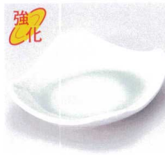
モ79-41-2 青白 富士山型浅鉢 (11.1×11.1×3.2cm) ¥1,200 2224079041