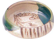
モ79-22-2 織部 丸鉢 (φ11.5×3.8cm) ¥1,900 1224072023