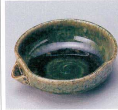
ケ79-34-2 織部 片口小鉢 (11.5×10.5×3.3cm) ¥1,500 1630055035