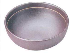
ケ79-112-2 南蛮白線 丸小鉢 (φ11×4.3cm) ¥1,500 1430072011