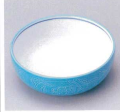
ツ79-35-2 トルコ 丸鉢 (φ11×4cm) ¥1,600 1421073014