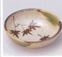
ケ79-45-2 手描織部 丸皿 (φ11×3cm) ¥1,100 1430072022