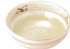
ケ79-24-2 若草 丸小鉢 (φ11×4.3cm) ¥1,500 1430072013