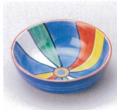
ツ79-42-2 丸紙風船 小鉢 (φ10.5×3.5cm) ¥1,200 1204075022