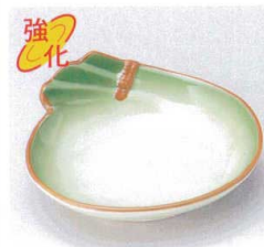
モ79-52-2 緑彩 袋型松花堂 (11.3×11.2×3.6cm) ¥960 2224079052