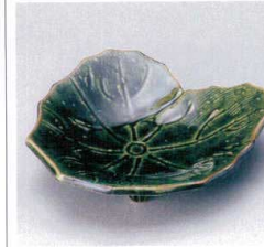
リ79-54-2 織部つわぶき ミツ足皿 (12.5×11×3cm) ¥800 2229079054