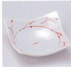
マ79-33-2 草花 四方小鉢 (10.8×10.8×4cm) ¥1,200 1407074022