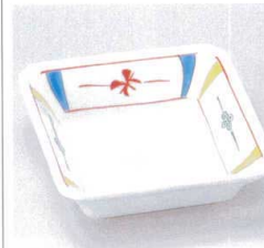
エ79-53-2 染錦見込小花 角小鉢 (11.2×11.2×3.5cm) ¥1,000 1201073033