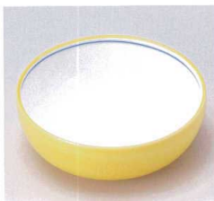
ツ79-31-2 黄草花彫 丸鉢 (φ11×4cm) ¥1,600 1221075013