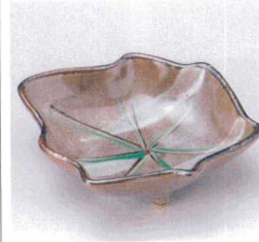
リ79-43-2 唐津赤画 楓型鉢 (13×11.3×3.5cm) ¥1,030 1429077024