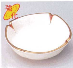
モ79-32-2 浏金イチョウ 松花堂 (赤) (11×11×3.3cm) ¥1,400 2224079032