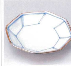
リ79-55-2 染付花間取 八角小皿 (12×11.5×2.5cm) ¥800 2229079055

剛直鉢 千代口 角付 中鉢 小鉢 小付 珍味入 松花堂 蓋向付 威物鉢 小盛鉢 蒸し籠 土瓶蓋し 焼物皿 仕切り皿 突出皿 結露 専用皿鉢 煎茶皿 天皿 呑水 和皿 鉢々皿 小皿 盛皿・鉢 大皿・鉢 細鉢 補鉢 焼酎 カップ ゴブレット 酒器 卓上小物 調理用品