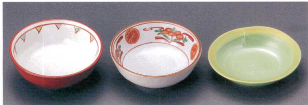
ソ81-11-2 朱巻十草 丸鉢 (φ11×4cm) ¥1,300 1201075054 リ81-12-2 乾山赤画 丸鉢 (φ11×4.5cm) ¥1,150 1429073011 ソ81-13-2 ヒワ釉金銀彩 とじめ小鉢 (11.5×10.8×3cm) ¥1,000 1404075051