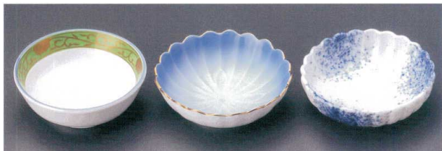
ソ81-24-2 もえぎ金蘭手 丸鉢 (φ11.5×4cm) ¥1,320 1404141016 ソ81-25-2 測金コバルト 菊型鉢 (φ11.2×3.7cm) ¥950 1204075034 モ81-26-2 吹墨 菊型鉢 (φ11.3×3.6cm) ¥710 1418073045