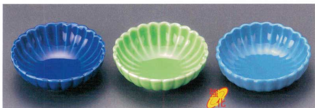
モ81-51-2 ルリ 菊型鉢 (φ11×3.5cm) ¥630 2024073023 モ81-52-2 ヒワ 菊型鉢 (φ11×3.5cm) ¥630 1425055046 モ81-53-2 トルコ 菊型鉢 (φ11.3×3.7cm) ¥1,020 2224081053