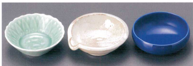
リ81-31-2 深海青磁双魚 小鉢 (φ11.3×4cm) ¥820 2129072026 ソ81-32-2 御本手くしめ 片口小鉢 (12.5×12×4cm) ¥800 1404072051 ケ81-33-2 トルコ釉鉄鉢 小鉢 (φ10.8×4.5cm) ¥760 1430073052