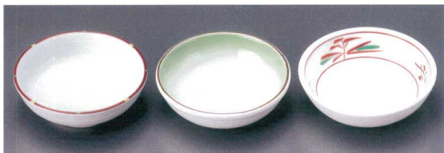
ソ81-44-2 八坂 丸鉢 (φ11×3.5cm) ¥950 2024072052 ケ81-45-2 ヒワ吹測金 丸小鉢 (φ11.2×3.1cm) ¥880 1430073024 ソ81-46-2 赤絵 丸鉢 (φ11.3×3.2cm) ¥950 1621074045