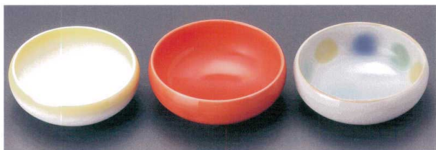
ソ81-41-2 イエロー吹鉄鉢 小鉢 (φ10.3×4.5cm) ¥720 1204075021 エ81-42-2 オレンジ鉄鉢 小鉢 (φ10.7×4.5cm) ¥850 1215056034 エ81-43-2 三色吹鉄鉢 小鉢 (φ10.7×4.5cm) ¥1,100 1215056031