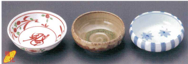
ケ81-14-2 万寿菊 丸小鉢 (φ11.7×4cm) ¥1,300 1430073055 ケ81-15-2 美濃伊賀 3.3丸小鉢 (φ11×4.3cm) ¥1,050 1430072023 ソ81-16-2 十草春秋 丸鉢 (φ10.8×4.3cm) ¥1,100 1204075023