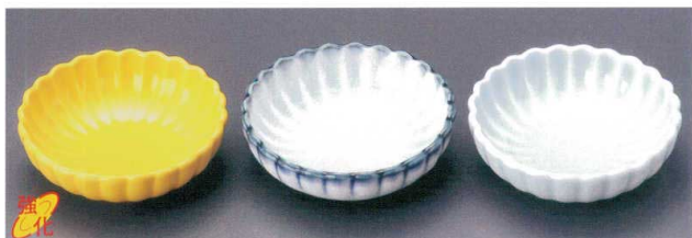
モ81-54-2 黄 菊型鉢 (φ11×3.6cm) ¥1,020 2024072032 モ81-55-2 御深井 菊型鉢 (φ11.3×3.6cm) ¥710 1418072033 モ81-56-2 青磁 菊型平鉢 (φ11.3×3.6cm) ¥680 1818082052