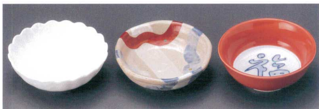
ワ81-34-2 白釉 菊型小鉢 (φ11.5×3.5cm) ¥760 2009073036 モ81-35-2 赤絵志野陽炎 3.5浅鉢 (φ11.5×3.3cm) ¥870 1424073034 ソ81-36-2 柿釉見込福 丸小鉢 (φ11.2×4.3cm) ¥830 1604074051