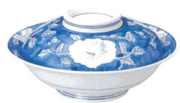
リ86-53-2 一珍牡丹 8.0骨蒸し碗 (φ24.5×12cm) ¥6,800 1429083052 リ86-54-2 一珍牡丹 7.0骨蒸し碗 (φ21.5×10cm) ¥4,650 1429083051