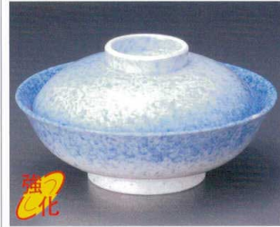
セ86-43-2 吹墨 平蓋向 (φ16.7×9cm) ¥2,800 2032081032