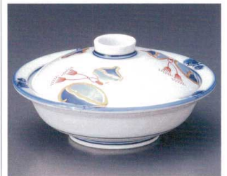
チ86-24-2 錦ひさご 蓋向付 (φ14.5×7cm) ¥2,700 2008080043