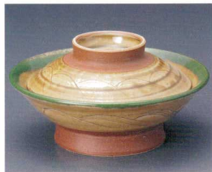
工86-31-2 灰釉織部流し 蓋向 (φ16.5×6.7cm) ¥2,200 2215086031