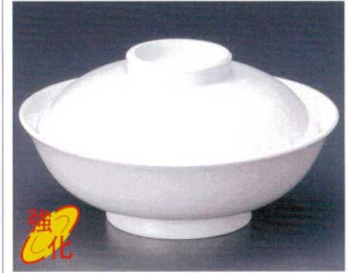
セ86-44-2 ピンク吹 平蓋向 (φ16.7×9cm) ¥2,800 2032081031