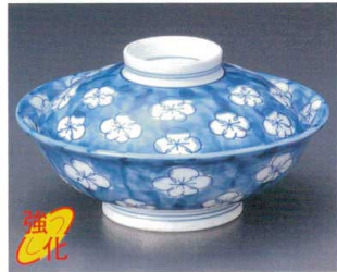
モ86-41-2 梅づくし 蓋向 (φ16.5×8.5cm) ¥2,550 2214081041