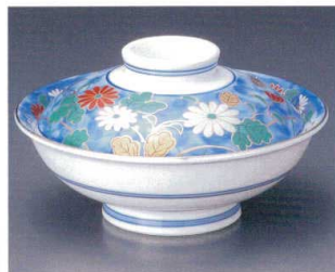
ケ86-22-2 染錦あけぼの菊 蓋向付(小) (φ16×8.8cm) ¥2,200 1430212029