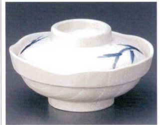
ト86-34-2 石焼笹 フタ向付 (φ15.5×8cm) ¥1,400 2016081044