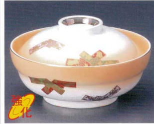
フ86-13-2 華結び 京型蓋向付 (φ14.3×7.7cm) ¥3,000 1409082034