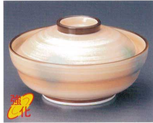
ケ86-12-2 オレンジ巻グリーン吹 京型蓋向 (φ14.4×8cm) ¥3,240 1830086022