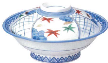
モ86-51-2 間取もみじ 7.0骨むし碗 (φ23×11.5cm) ¥6,000 1624083052