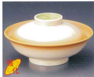
モ86-32-2 黄彩 平蓋向付 (φ16.7×9cm) ¥2,600 1824088013