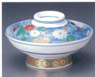
ケ86-21-2 染錦あけぼの菊 蓋向付(大) (φ16.7×9.5cm) ¥2,600 1430212028