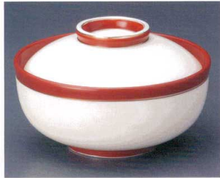
ツ86-11-2 赤玉淵 小蓋向付 (φ12.3×7.8cm) ¥3,350 1221086051