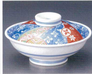
リ86-42-2 錦花菱 蓋向 (φ16×9cm) ¥2,400 1829089024