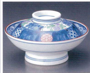
ケ86-23-2 錦丸紋ひさご 蓋向付 (φ16.6×9.5cm) ¥2,100 1430216011