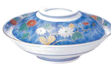
ケ86-52-2 染錦あけぼの菊 7.0鯛蒸し碗 (φ21.2×9.6cm) ¥4,400 1830088052