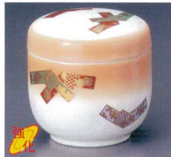
ワ94-21-2 華結び 夏目型むし碗 (φ7.8×7.8cm) ¥2,060 1409095032