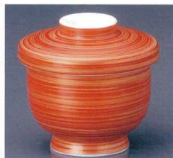
ツ94-33-2 朱雲金巻 ミニむし碗 (φ6.8×7.2cm) ¥1,800 1821102022