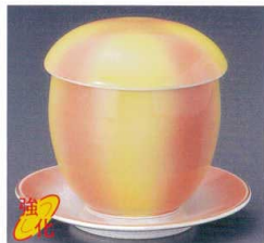
ワ94-25-2 二色吹 玉むし碗 (φ8.2×8.3cm) ¥1,880 1809099012 ワ94-26-2 オレンジ吹 受皿 (φ10.5×1.5cm) ¥600 1809099013