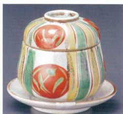
ソ94-47-2 十草赤丸紋 だるま蒸し碗 (φ7.4×8.8cm) ¥2,350 1204093042 ソ94-48-2 十草赤丸紋 蒸し受皿 (φ10.8cm) ¥630 1204093043