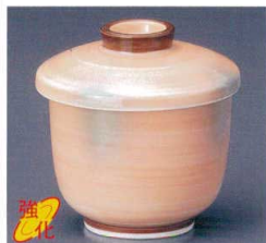
ケ94-32-2 オレンジ巻グリーン吹 京型蒸し碗 (φ7.6×8.5cm) ¥1,870 1830098041