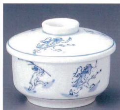
テ94-44-2 高山寺 平蒸し (φ9.4×7.6cm) ¥1,450 1822099031