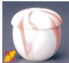
ソ94-24-2 銀彩ネジリ 蒸し碗(小) (φ7.5×7.5cm) ¥2,050 1622091013