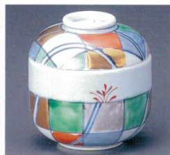
ソ94-34-2 金彩市松 蒸し碗 (φ7.7×8.5cm) ¥2,800 1204091013