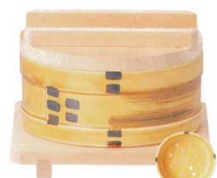
ワ94-54-2 陶器せいろ身(大) (φ13.8×6cm) ¥2,650 2022090055 ワ94-55-2 木蓋(大) (φ13.6×2.1cm) ¥1,200 2022090056 ワ94-56-2 木台(大) (14.6×14.6×2.1cm) ¥1,100 2022090057 ワ94-57-2 竹ス(大) (φ11.2cm) ¥480 2022090058