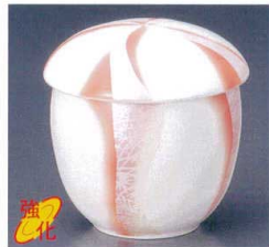
ケ94-23-2 銀彩ネジリ 蒸し碗(大) (φ7.4×8.5cm) ¥2,050 1630093022