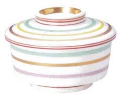
テ94-51-2 駒筋 平蒸し碗 (φ10×8.3cm) ¥2,150 1222094034