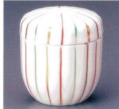
ル94-11-2 菊型十草 蒸し碗 (φ7.2×8cm) ¥2,800 1205091058