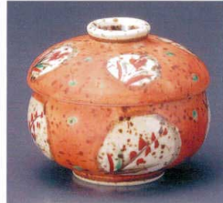
ケ94-12-2 朱巻むさしの丸紋 丸蒸し碗 (φ8.6×7cm) ¥2,650 1430092021