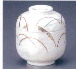
ツ94-14-2 ラスターすすき ミニむし碗 (φ7×8cm) ¥2,100 1821102014