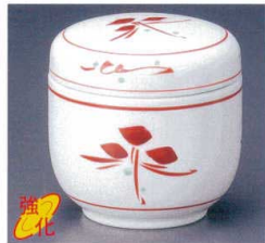
ワ94-22-2 小花 夏目型むし碗 (φ7.8×8cm) ¥2,060 1209091026