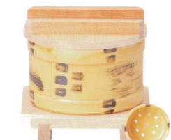
ワ94-58-2 陶器せいろ身(小) (φ10.1×6cm) ¥1,600 2022090051 ワ94-59-2 陶器せいろ身(小) 穴なし (φ10.1×6cm) ¥1,600 2109098059 ワ94-510-2 木蓋(小) (φ10.3×2cm) ¥950 2022090052 ワ94-511-2 木台(小) (11.2×11.2×2cm) ¥750 2022090053 ワ94-512-2 竹ス(小) (φ8.2cm) ¥320 2022090054