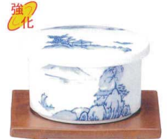
モ94-513-2 山水 せいろむし器 (φ9.9×6cm) ¥1,390 1224091047 モ94-514-2 茶マット 受台 (11.2×1.5cm) ¥590 1424092034