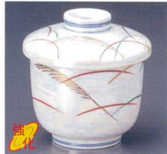
ツ94-15-2 ラスターむさしの 京形むし碗 (φ7.5×8.5cm) ¥2,100 1221092022