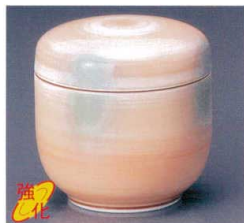
ケ94-31-2 オレンジ巻グリーン吹 夏目型蒸し碗 (φ7.8×7.6cm) ¥1,980 1830096011