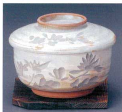
モ94-41-2 古萩彫蘭 むし碗 (φ11.5×8cm 315cc) ¥1,250 1224094042 モ94-42-2 焼杉台(10cm) (10×10cm) ¥140 1224094045