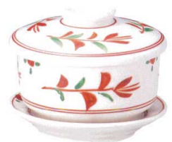
テ94-52-2 高麗花絵 平蒸し碗 (φ9.5×6.5cm) ¥1,800 1222094036 テ94-53-2 高麗花絵 受皿 (φ10.3cm) ¥700 1222094037