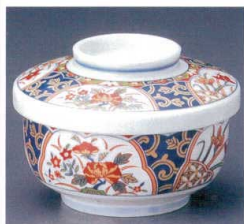
モ94-43-2 金彩錦草花 平むし碗 (φ10.3×8cm) ¥1,250 2024092021