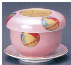
ソ94-45-2 ピンク手まり 蒸し碗 (φ9.7×7cm) ¥2,600 1204092012 ソ94-46-2 ピンク吹 受皿 (φ10.5cm) ¥650 1204092013