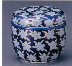
ソ94-13-2 ルリ春秋 蒸し碗 (φ7.8×7.5cm) ¥2,200 1804096045