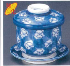
モ95-34-2 梅づくしむし碗(大) (φ8×8.8cm) ¥1,400 2024091055 モ95-35-2 梅づくし受皿 (φ10.3×1.5cm) ¥640 2024091056