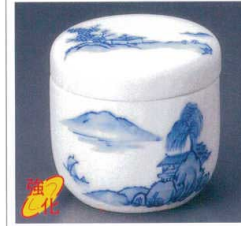
モ95-36-2 山水夏目むし碗 (φ7.5×7.8cm 170cc) ¥1,450 1224091034