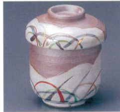
ツ95-22-2 南蛮すずきむし碗 (φ8×9cm) ¥1,900 1221093032