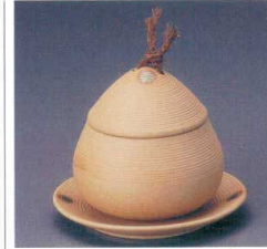
ソ95-17-2 土物筋 蒸し碗(小) (φ6×8cm) ¥1,400 1404094511 ソ95-18-2 土物筋 蒸し碗(小)受皿 (φ10.7cm) ¥560 1404094512