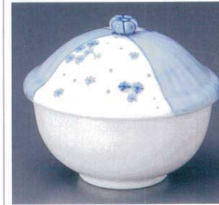
ツ95-53-2 染付菊 姫蓋物 (φ10.5×9cm) ¥1,850 2221095053