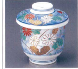
ケ95-25-2 染錦あげぼの菊 蒸し碗(小) (φ7×9.1cm) ¥1,850 1430212030