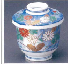
ケ95-24-2 染錦あげぼの菊 蒸し碗(大) (φ8×9.8cm) ¥2,050 1430212031