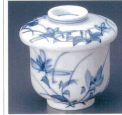
ケ95-44-2 古染菊むし碗 (φ8.5×9.1cm) ¥1,500 2130086032