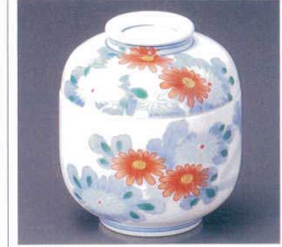
ツ95-19-2 染錦みやび ミニむし碗 (φ7×8.2cm) ¥1,650 1221097012