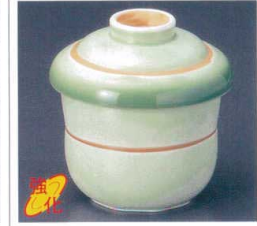
モ95-37-2 緑彩むし碗 (φ7.2×8.9cm 165cc) ¥1,250 1227091035