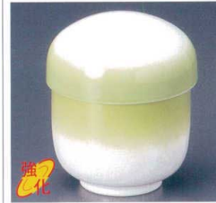
セ95-43-2 新緑丸型むし碗 (8.5×9.5cm) ¥1,400 2032092011