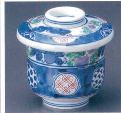
ケ95-42-2 錦丸紋ひさご蒸し碗 (8.5×9.5cm) ¥2,000 1430216012