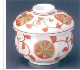
チ95-45-2 丸紋唐草腰丸型むし(中) (φ7.9×7.9cm 170cc) ¥1,250 2008097023(中国製)