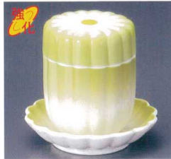
モ95-13-2 新緑菊形むし碗 (φ7×8.8cm 155cc) ¥1,400 1427095016 モ95-14-2 新緑 受皿 (φ10×2.5cm) ¥700 1824099027