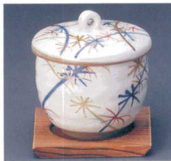
カ95-31-2 赤画京華むし碗 (φ7.5×9.5cm) ¥1,600 1214093022 カ95-32-2 焼杉台 (8.5×8.5cm(浜受けφ5.8cm)) ¥220 1214093023