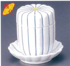
モ95-11-2 細十草 菊形むし碗 (φ7×8.8cm 155cc) ¥2,030 1424093021 モ95-12-2 細十草 菊形受皿 (φ10×2.5cm) ¥860 1424093022