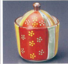
ル95-23-2 粉引梅紋 蒸し碗 (φ8.4×9.2cm) ¥1,950 1205093044