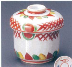
キ95-21-2 赤絵むし碗 (φ7.8×8.5cm) ¥2,000 2213095021