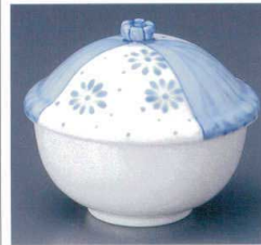
ツ95-52-2 染付松 姫蓋物 (φ10.5×9cm) ¥1,850 2221095052