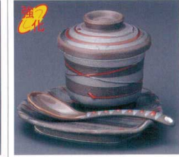
セ95-55-2 錆濁蒸し碗 (φ7.2×8.8cm) ¥1,400 1832102031 セ95-56-2 錆濁受皿 (13×13×2cm) ¥1,300 2032091053 セ95-57-2 錆濁スプーン (13.3×2.5×2.4cm) ¥600 2032091054