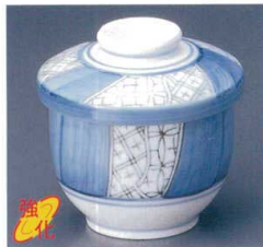
テ95-41-2 祥瑞むし碗(小) (φ8.5×8.2cm) ¥1,500 2211095041