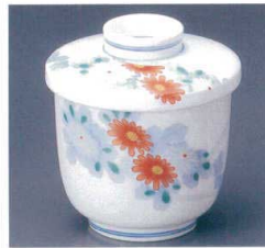
ツ95-33-2 染錦みやびむし碗 (φ8×9.8cm) ¥1,300 1621094024