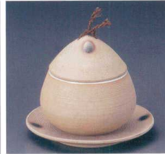
ソ95-15-2 土物筋 蒸し碗(大) (φ7×9cm) ¥1,720 1204093510 ソ95-16-2 土物筋 蒸し受皿(大) (φ12cm) ¥640 1204093511