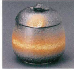
ス97-13-2 黒備前 むし碗 (φ9×10cm) ¥1,000 2026094041