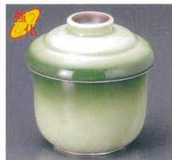
モ97-24-2 緑釉 むし碗 (φ7.2×8.5cm) ¥1,000 1225095018