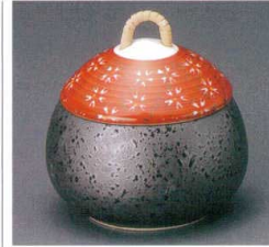
ヒ97-14-2 芝桜 むし碗 (φ9.5×9.5cm 230cc) ¥1,360 2217097014