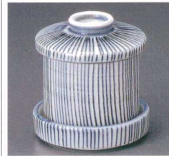
ス97-36-2 千筋 小蒸し碗 (φ7×8.3cm) ¥1,050 1226094514 ス97-37-2 千筋 蒸し受皿 (φ8.5×2cm) ¥340 1226094515