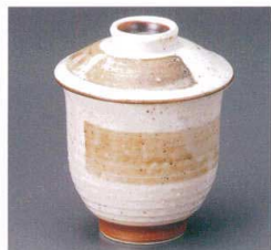
モ97-23-2 茶刷毛 むし碗 (φ8.2×9.3cm 180cc) ¥880 1624091012