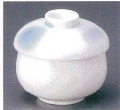
ス97-42-2 三色吹 腰丸 むし碗中 (φ7.8×7.8cm 170cc) ¥980 2126088043 (中国製)