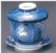
モ97-31-2 京祥瑞 むし碗 (φ9.2×9cm 250cc) ¥780 2224097031 モ97-32-2 京祥瑞 受皿 (φ10.7×1.8cm) ¥370 2224097032