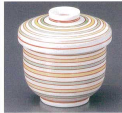
キ97-43-2 三色駒筋 並形 むし碗 中 (φ7.6×8.7cm 190cc) ¥1,100 2113088022 (中国製)