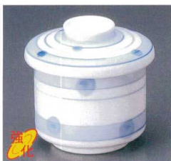
モ97-51-2 ダミライン むし碗 (φ7×8cm 150cc) ¥910 1624095035