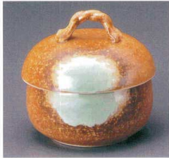
ヒ97-11-2 伊賀風 むし碗 (φ9.8×10cm) ¥960 2017092059