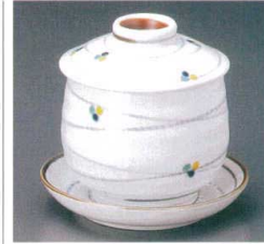
ス97-15-2 うず水玉 蒸し碗 (φ7.7×9cm) ¥980 1626094047 ス97-16-2 うず水玉 受皿 (φ10cm) ¥350 1626094048