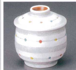
セ97-25-2 渦水玉 蒸し碗 (φ8.6×9cm) ¥900 1832100046