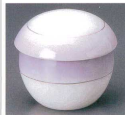
キ97-54-2 紫吹金線 新丸 むし碗(中) (φ7.5×7.8cm 180cc) ¥1,050 2013097034 (中国製)