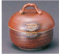
ヒ97-12-2 備前風 むし碗 (φ9.8×10cm) ¥960 2017092058