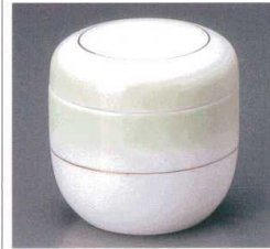
ス97-44-2 ヒワ吹金線 夏目型 むし碗中 (φ7.8×7.8cm 180cc) ¥930 2026097048 (中国製)