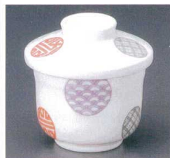
モ97-53-2 源氏丸紋 むし碗 (φ7.4×8.3cm 170cc) ¥780 1424098057