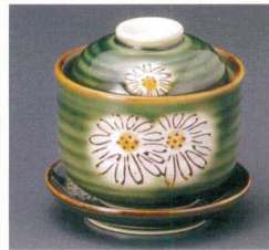
モ97-34-2 織部菊 むし碗 (φ8.3×8cm 130cc) ¥960 1624094041 モ97-35-2 織部菊 受皿 (φ9.5×1.8cm) ¥320 1624094042