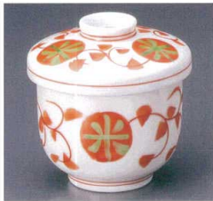
ミ97-41-2 丸紋唐草 並形蒸碗中 (φ7.6×8.7cm) ¥1,100 2123088041 (中国製)