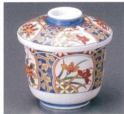
モ97-33-2 金彩錦草花 むし碗 (φ8.2×9.5cm) ¥950 2024093056