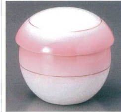
ス97-45-2 ピンク吹金線 新丸型 むし碗中 (φ7.5×7.8cm 180cc) ¥1,050 2026097044 (中国製)