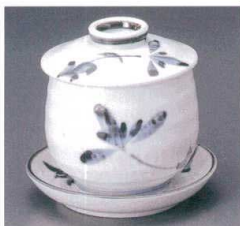
モ97-21-2 古代菊 むし碗 (φ8.5×9cm 225cc) ¥1,000 1224094510 モ97-22-2 古代菊 むし受皿 (φ10.3×2cm) ¥350 1224094511