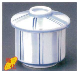
モ97-52-2 親子十草 むし碗 (φ6.8×7.8cm) ¥910 2224097052