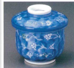
モ97-26-2 ダミ花唐草 むし碗(大) (φ8.3×9.5cm) ¥940 2124088035