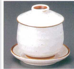
モ97-38-2 ソバ志野 むし碗 (φ8×9cm) ¥1,000 2024093023 モ97-39-2 ソバ志野 受皿 (φ10×1.8cm) ¥350 2024093024