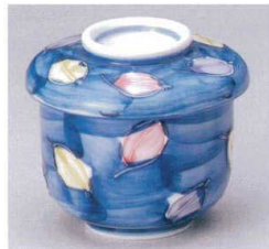
モ98-31-2 一珍木の葉 小むし碗 (φ8.5×8cm 170cc) ¥800 2224098031