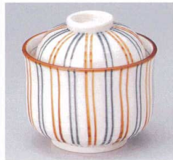
モ98-22-2 二色十草 タルマ形むし碗 (φ8.5×8.5cm 130cc) ¥810 1224095053