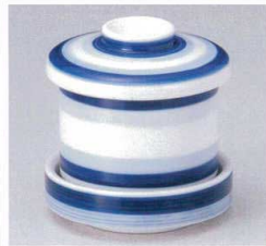
モ98-55-2 二色帯 むし碗 (φ7×8.2cm 160cc) ¥600 1624095041 モ98-56-2 二色帯 受皿 (φ8.4×2.3cm) ¥280 1624095042