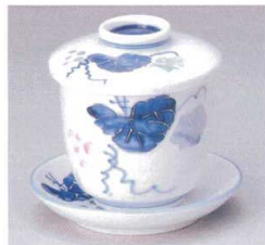
モ98-41-2 一珍ブドウ むし碗 (φ7.5×9.5cm) ¥900 2024094011 モ98-42-2 一珍ブドウ 受皿 (φ10.5×1.7cm) ¥500 2024094012