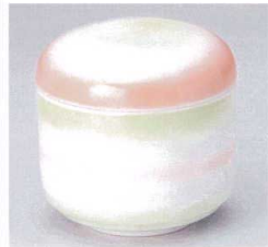
チ98-35-2 白磁二色吹 丸蒸し碗 (φ8×7.5cm) ¥900 1408097032