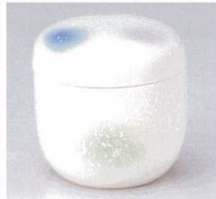
ミ98-13-2 三色吹 夏目形むし碗(中) (φ7.8×7.8cm 180cc) ¥880 2023097410 (中国製)