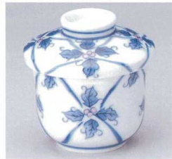
モ98-24-2 千両 むし碗(小) (φ7.4×8.3cm 170cc) ¥780 1627096013