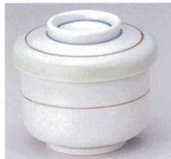
セ98-21-2 葵 蒸碗 (φ9.3×8.3cm 210cc) ¥860 2132089031