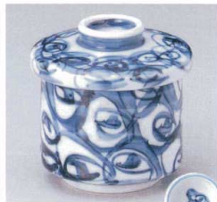
モ98-48-2 水泡 むし碗 (φ7×8cm 160cc) ¥880 1224095056