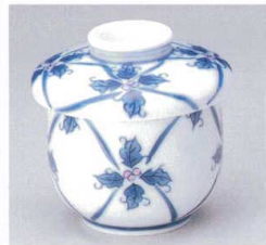
モ98-47-2 千両 むし碗 (φ9.2×9cm 250cc) ¥800 2224098047