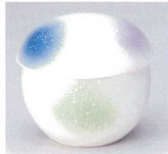
ミ98-14-2 三色吹 新丸形蒸碗 中 (φ7.5×7.8cm) ¥980 2123089012 (中国製)