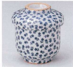
ス98-15-2 小花 蒸し碗 (φ7.3×9cm) ¥870 1626095033