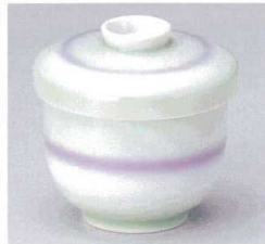
キ98-12-2 二色吹 並形むし碗(中) (φ6.7×8.7cm 190cc) ¥820 21130895053 (中国製)