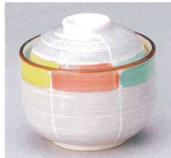
モ98-11-2 三色刷毛目 むし碗 (φ8.5×8.5cm 130cc) ¥930 2024093034

刺身鉢 干代口 両付 中鉢 小鉢 小付 珍味入 松花堂 蓋向付 煮物籠 小吸碗 蒸し碗 土瓶蒸し 焼物皿 仕切り皿 突出皿 鮎皿 多用皿鉢 前菜皿 天皿 呑水 和皿 銘々皿 小皿 盛皿・鉢 大皿・鉢 組鉢 組弁 強化 焼酎 カップ ゴブレット 酒器 卓上小物 調理用品