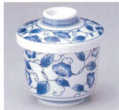
モ98-54-2 葉唐草 むし碗 (φ8.1×9cm) ¥410 1227096023