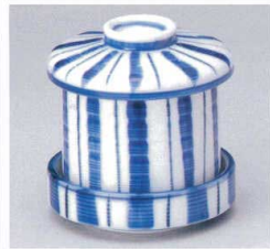
モ98-57-2 太十草 むし碗(厚口) (φ7×8.2cm 160cc) ¥600 1224095011 モ98-58-2 太十草 受皿 (φ8.4×2.3cm) ¥280 1224095012