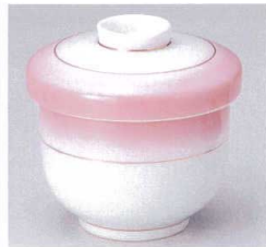
キ98-32-2 ピンク吹淵金 並形むし碗(中) (φ7.6×8.7cm 190cc) ¥850 2013097041 (中国製)