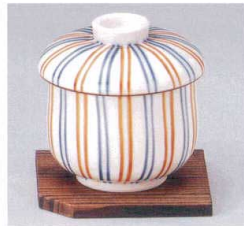
モ98-33-2 二色十草 小むし碗 (φ7×8cm 150cc) ¥800 1824103035 モ98-34-2 焼杉台(8cm) (8×8cm) ¥140 1224095054