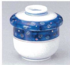
モ98-59-2 帯木の葉 むし碗 (φ8.9×9.1cm) ¥780 2024094023