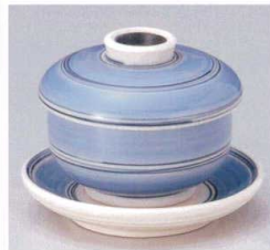
モ98-45-2 太駒筋(青) ミニミニむし碗 (φ7×6.2cm 120cc) ¥850 2224098045 モ98-46-2 太駒筋(青) 受皿 (φ9×2cm) ¥300 2224098046