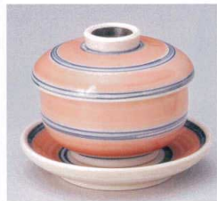
モ98-43-2 太駒筋(ピンク) ミニミニむし碗 (φ7×6.2cm 120cc) ¥850 2224098043 モ98-44-2 太駒筋(ピンク) 受皿 (φ9×2cm) ¥300 2224098044