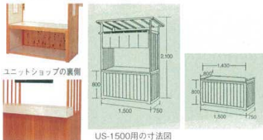
カウンターを付けた使用例

仕様：構造／天然木、木枠ユニット構造 天板／メラミン化粧板、木枠構造 表面／高級ウレタン塗装