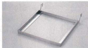
③陶器ガストロノームパンホルダー 2123 1626000 (2/3サイズ用) 18-8ステンレス 外寸：323×355×H55