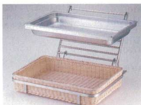
①オーガナイザースタンド 2121+⑦ブレードバスケットホルダー 2127+④ホテルパンホルダー 2124 ※ホテルパン1/1・籐カゴP-4は別売りです。