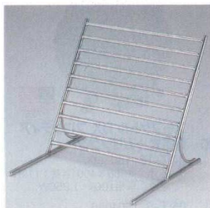
①オーガナイザースタンド 2121 1625800 18-8ステンレス 外寸：380×360×H350