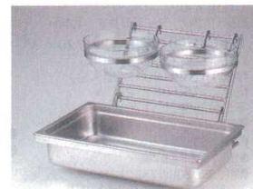
①オーガナイザースタンド 2121+②陶器ガストロノームパンホルダー 2122+⑥サラダボールホルダー 2126+④サラダボールホルダー 2126 ※ホテルパン1/1・サラダボール23cmは別売りです。