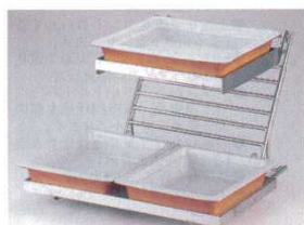
①オーガナイザースタンド 2121+②陶器ガストロノームパンホルダー 2122+③陶器ガストロノームパンホルダー 2123 ※陶器ガストロノームパン2/3・1/2は別売りです。