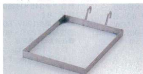
⑤ホテルパンホルダー 2125 1626200 (1/2サイズ用) 18-8ステンレス 外寸：252×365×H55