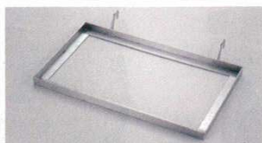
②陶器ガストロノームパンホルダー 2122 1625900 (1/1サイズ及び1/2サイズ×2ヶ用) 18-8ステンレス 外寸：510×355×H55