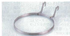
⑥サラダボールホルダー 2126 1626300 (φ230用) 18-8ステンレス 外寸：φ227×287×H55