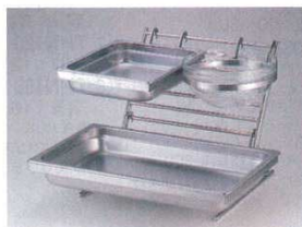
①オーガナイザースタンド 2121+④ホテルパンホルダー 2124+⑤ホテルパンホルダー 2125+⑥サラダボールホルダー 2126 ※ホテルパン1/1・1/2及びサラダボール23cmは別売りです。