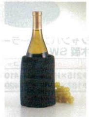
⑰ エビバックワインクーラー 115-73000 φ95×130×H155 1091900

●ワインを数分で冷やし、約2時間保冷できます。 ●冷凍庫で冷やされたジェルで、ボトルを冷やしますのでテーブルが水滴などで汚れる心配がありません。