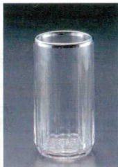
⑬ クリスタルワインクーラー アクリル製 φ120(φ96)×H235

4300200 ●ダブルウォールで保冷効果に優れています。 ●氷が不要で、落ちずテーブルが汚れません。