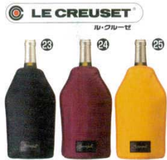
LE CREUSET ル・クルーゼ スクリュブル 50142 アイスクーラーズリーブ WA126

パンケット・サービスタコン パンケット用品 ウォーター 卓上器物 洋 料理演出用品 和 鍋物用品 和・洋・中 喫茶サービス用品 グラス・ワイン・バー用品 カトラリー キャンプロシリーズ