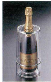
⑧ ワインクーラー IG-222 アクリル アメリカ φ120(φ100)×H230