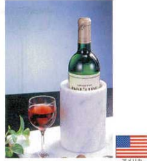
① ワインクーラー マーブル φ114(φ100)×H153 1851000

155×20×H230 重量：490g ●冷凍庫で冷やせる便利なワインクーラーです。 ●ワイン、シャンパン、スパークリングワインに使用出来ます。