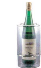
⑥ ワインクーラー 3321H アクリル φ115(φ95)×H230