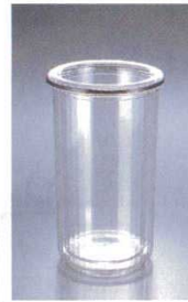
⑨ ワインクーラー 5590 アクリル アメリカ φ139(φ90)×H235