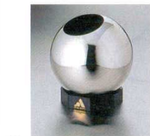
⑱ ワインクーラー LAM-503 ゴム付 18-8 パールベッセル 5297300 φ170(φ85)×H170

●ワインを数分で冷やし、約2時間保冷できます。 ●冷凍庫で冷やされたジェルで、ボトルを冷やしますのでテーブルが水滴などで汚れる心配がありません。