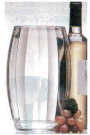
⑩ ワインクーラー AP-41 アクリル アメリカ φ140(φ100)×H230