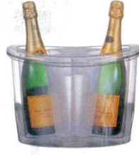
③ ツインボトル 保冷 シャンパンクーラー WF-029 アクリル 320×210×H230 1018700

●冷やしたボトルを入れると、本体の構造が外気をシャットアウトし、瞬時に冷気がボトルを包み、飲みごろの冷たさを1時間以上保たせる氷不用のワインクーラーです。