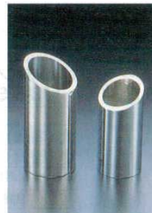
ワインクーラー 18-8 ⑭ #171(フルサイズ) 3311800 φ118(φ95)×H250

4300200 ●ダブルウォールで保冷効果に優れています。 ●氷が不要で、落ちずテーブルが汚れません。