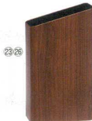
㉓ サイドバケット(小)

商品コード ⑳ OXL-39 ライトオーク 5198000 ㉑ OXL-40 ミディアムオーク 5198100 ㉒ OXL-41 ダークオーク 5198200 243×130×H420 材質：スチール、印刷