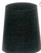
⑱ ダストボックス 底広 セン材 木製 B-900