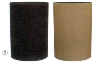
② ダストBOX M モクメ

商品コード 285×195×H330 0766900 容量：4.2ℓ×2 重量：1.5kg ●片側に350ml缶なら5・6本入ります。 ●個々の容器にポリ袋がセットできます。