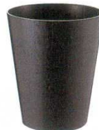
⑯ ダストボックス ルーム用 木製 B903