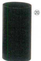
⑳ ダストボックス スリム セン材 B-970S