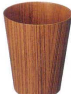
⑫ ダストボックス 蓋無 チーク

商品コード ⑨ 901WN φ230×H280 5199700 ⑩ 903WN φ255×H300 5199800 ⑪ 905WN φ285×H400 5199900