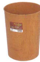
㉑ ダストボックス トス (木目調) R-30