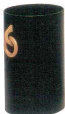
⑰ ダストボックス リング付 セン材 木製 B-955