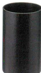
⑮ ダストボックス ルーム用 木製 B111

商品コード ⑫ 大 φ285(φ195)×H405 1798800 ⑬ 中 φ255(φ172)×H300 1798900 ⑭ 小 φ230(φ155)×H280 1799000