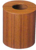
⑥ ダストボックス 蓋付 チーク

商品コード ④ 952H 大 φ205×H285 8477500 ⑤ 951H 中 φ185×H210 8477600