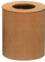
④ ダストボックス 蓋付 セン材 木製

商品コード ② ブラウン 1184000 ③ ナチュラル 1184100 φ186×H270 容量：6.8ℓ ABS樹脂・ウレタン塗装