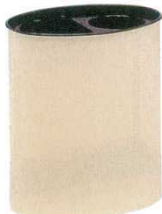
① インテリアボックス 分別タイプ楕円 EXL-51 アイボリー

商品コード 285×195×H330 0766900 容量：4.2ℓ×2 重量：1.5kg ●片側に350ml缶なら5・6本入ります。 ●個々の容器にポリ袋がセットできます。