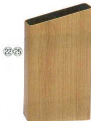
㉒ サイドバケット(大)

商品コード ⑳ OXL-39 ライトオーク 5198000 ㉑ OXL-40 ミディアムオーク 5198100 ㉒ OXL-41 ダークオーク 5198200 243×130×H420 材質：スチール、印刷