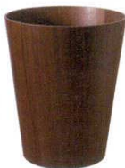
⑨ ダストボックス 蓋無 ウォールナット

商品コード ⑥ 大 φ205×H285 1798500 ⑦ 中 φ185×H210 1798600 ⑧ 小 φ160×H145 1798700