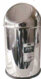
㉕ フルーツパール L

φ180×H230 7569400 ㉕ 容量：約5ℓ 材質：ステンレス ●本体内部にフックが付いているのでポリ袋がセットできます。