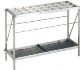
③ レインスタンド 24本立 折りたたみ式 18-8 EBM 730×260×H510 3494200