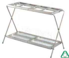
⑯ アンブラー X-20 (21本立) ブラック 596×314×H495 7576800 本体：スチールメラミン焼付 シート：塩化ビニル