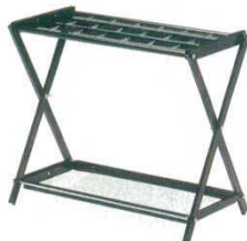
⑭ アンブラー X-40 (40本立) ブラック 820×408×H495 7576700 本体：スチールメラミン焼付 シート：塩化ビニル