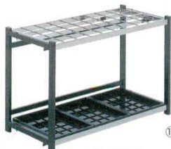
⑩ 24本立 523×366×H500 2873300 ⑪ 36本立 760×366×H500 2873400 材質：本体／スチール (焼付け塗装＋クロームメッキ) 受皿／ポリプロピレン (再生樹脂)