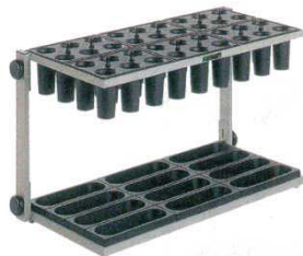
傘立台 折りたたみ式 アーバン 外寸 商品コード ④ 24本立 762×255×H477 3494300 ⑤ 36本立 804×353×H477 3494400 ⑥ 48本立 1,042×353×H477 3494500 フレーム：スチール アクリル塗装 シート：ポリプロピレン (再生樹脂)