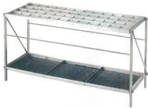
① レインスタンド 48本立 折りたたみ式 18-8 EBM 1,000×360×H510 3494000