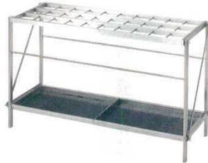
② レインスタンド 30本立 折りたたみ式 18-8 EBM 860×320×H510 3494100