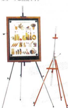
スチールイーゼル

550×500×H1,200 1188100 ※マグネットが使える。 ※マーカーブラックには専用ペンをご使用ください。