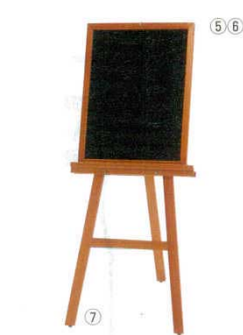
ネオカラーウッディー