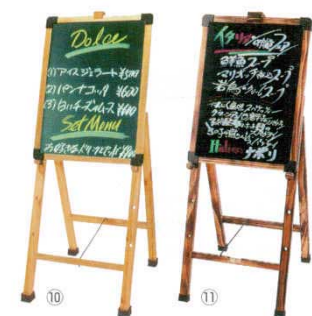
木製メニューイーゼル