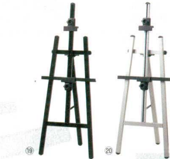
メニュースタンド アルミ製

サイズ:最大1,140×1,020×H920 最小 660× 580×H850 焼付塗装/クロームメッキ仕上 ※キャリパー付。 ※ボードは別売です。