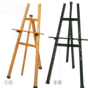
イーゼル 木製 白木 シンビ