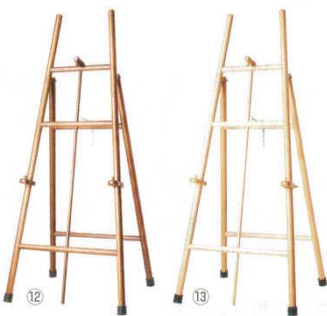
木製メニューイーゼル