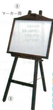
⑧ ネオカラーウッディー Nタイプ