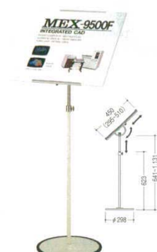
③ 店頭スタンド ローリー 45 7699100 パネルサイズ: 450×H450 材質: 本体/スチール製 パネル/アクリル