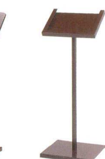
⑪ メニュースタンド ブラウン 400×350×H1,030 7286700 プレートサイズ: 374×278×30 スチール製 ※B4サイズまで対応します。