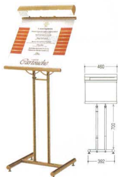
① 店頭スタンド ライティングディグリーⅡ ゴールド 7699910 パネルサイズ: 450×H450 材質: 本体/スチール製 パネル/アクリル 電源: 単相100V・40W、スイッチ付 ランプ: 40Wキセノンボールランプ (E-17)、2.5mコード付