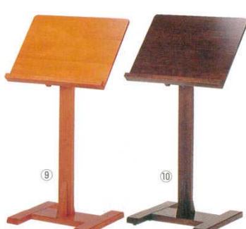
メニュースタンド 商品コード ⑨ ナチュラル 5667200 ⑩ 古代色 5667300 600×450×H1,100 プレートサイズ: 600×430 スプルス材