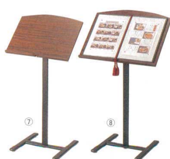
メニューブック台 ⑦ SS-80 7694100 サイズ: 本体/560×400×H1,010 ボード/500×370 ※A4Wタイプ ⑧ SS-70 7694200 サイズ: 本体/600×400×H1,150 ボード/600×450 ※B4Wタイプ