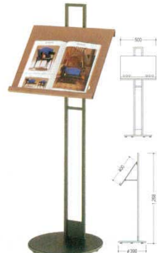
⑤ メニュースタンド リオン 7700400 パネルサイズ: 500×H400 材質: スチール製