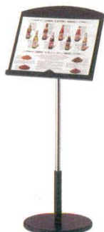
⑥ メニュースタンド クレオ φ360×H1,134 7700210 パネルサイズ: 480×H400 材質: 本体/スチール石目調塗装、支柱/クロムメッキ