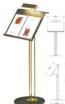
④ メニュースタンド ルミエ 7700100 パネルサイズ: 560×H425 材質: スチール製 電源: 単相110V・60W ランプ: 30Wクリアスペース球 (E-17) 2灯、2.5mコード付