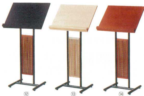
メニュースタンド 飾り縦格子