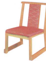
白木布あけぼの 朱