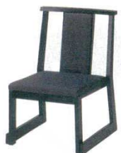
黒塗レザー 黒 かすり