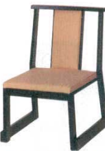
黒塗布京友禅 ゴールド