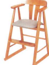
㉗ 天然木ハイチェア ET-16-8