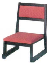
黒塗布江戸かがり 朱