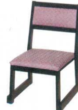
黒塗布都友禅 むらさき