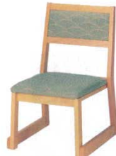
白木塗布あけぼの グリーン