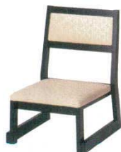
黒塗布江戸かがり 白