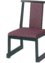
黒塗レザー むらさき かすり