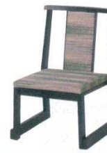
黒塗布都西陣 グリーン