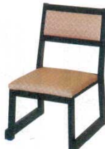
黒塗布都友禅 ゴールド