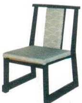
黒塗布あけぼの グリーン