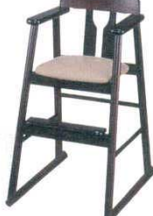
㉘ ブナハイチェア ET-16-9