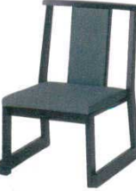
黒塗レザー グリーン かすり