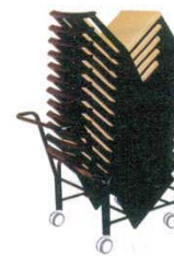
㉙ スチール台車 手付 ET-16-16

3896000 材質：スチール メラミン焼付塗装 ※⑬ ET-12-19 タイプで15脚まで積むことが出来ます。 ※①～⑮用