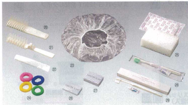
⑳ ムースブラシ (500本入) 165×40×H27 6857000 (1本ナイロン袋入)