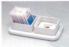
⑪ 273SIW ティーバッグセット 192×108×H41 0973900