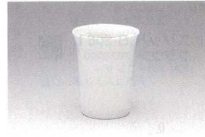
⑱ 741IW タンブラー 小 190cc 72×H90 0974600