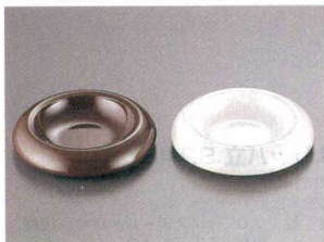
⑦ 灰皿 丸型 メラミン HG-2