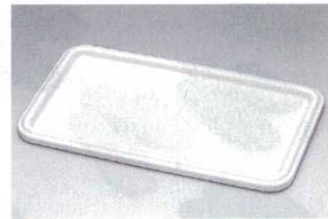
⑫ 278IW トレー 中 305×175×H16 0974000