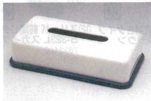
⑮ 296IW ティッシュボックス (浅型) 285×155×H69 0974300