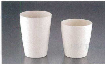
⑧ タンブラー HG ホワイトメラミン

商品コード MN-17 (小) 200cc φ74×H80 4445200 MN-18 (大) 270cc φ74×H99 4445300 ※色は、ホワイトのみです。