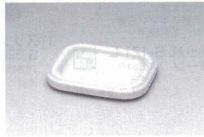
⑯ 254IW/W 石鹸入れ 小 95×75×H14 0974400