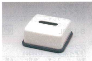
⑭ 295IW ハーフティッシュボックス 163×153×H71 0974200