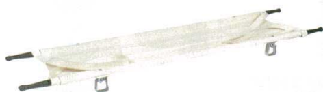
③ タンカ KZ-20A 折りたたみ式