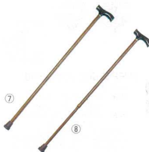
ブロナードステッキ アルミ製