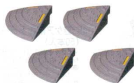
⑮ スーザーコーナー (4枚組) SZ-10C