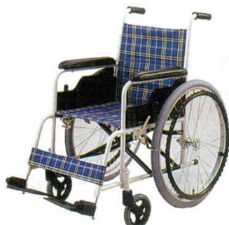
⑫ アルミ 車椅子 KZ-10L 折りたたみ式