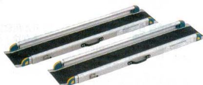
④ ワンタッチスロープ