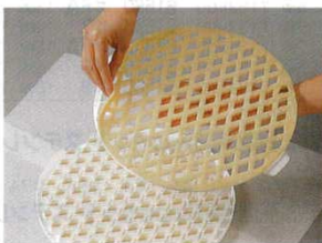
⑥ギッター 44265 PP製

幅：120mm 7141300 ※ハンドルは丈夫なポリエチレンです。ホイールの間隔は7mm。(ステンレス)