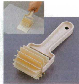
⑤ラインローラー 34073 PP製

幅：100mm 7141400 ※ハンドルが強化されています。ホイールの間隔は7mm。(ポリプロピレン)