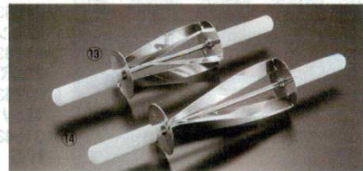
⑬クロワッサンカッター 44775