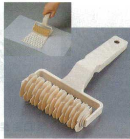
④メッシュローラー 34253 PP製

幅：100mm 7141400 ※ハンドルが強化されています。ホイールの間隔は7mm。(ポリプロピレン)