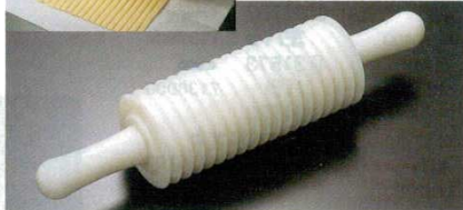
⑫カッティングローラー