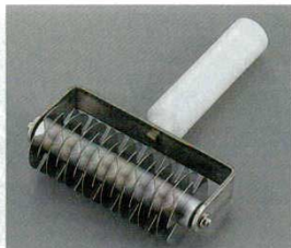
③メッシュローラー 68875 (ステンレス)

幅：120mm 7141300 ※ハンドルは丈夫なポリエチレンです。ホイールの間隔は7mm。(ステンレス)