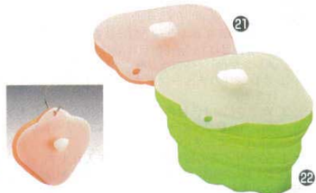
シリコン三角コーナー(蓋付)

270×380×H155 ※折りたたみ時：H65 材質：本体/シリコンゴム 枠芯材/ステンレス鋼 底芯材/66ナイロン 耐熱温度：約220℃ 満水容量：約7ℓ ●使わない時は畳んで、高さが半分以下になり、収納に場所とりません。 ●底部裏面には高さ、1.5cmの脚をつけているので、シンクの水の流れもスムーズです。 ●片側だけたんでラクラク排水。水が入った重い桶を傾ける必要がありません。