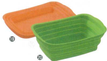
脚付きシリコン洗い桶