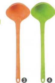
スマイルシリコンお玉

90×270 材質：スプーン先端部/シリコン樹脂 耐熱230℃ ハンドル部/66ナイロン 耐熱200℃ ●炒める、混ぜる、盛り付ける、など多用途に使えます。