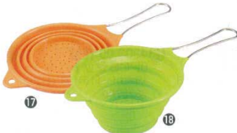
ハンドル付きシリコンストレーナー

185×275 耐熱温度：-30～220℃ ●約220℃に耐えるシリコン製なので熱い物の移動や熱湯の中へ入れられます。 ●汚れたらすぐに水洗いでき、耐熱性があるので食器洗い機・食器乾燥機でも使用可能です。