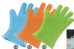
5本指クッキンググローブ(1枚)

35×210 材質：刷毛部/シリコン樹脂 耐熱230℃ ハンドル部/66ナイロン 耐熱200℃ ●刷毛と違い毛が抜けることが無く、お手入れも簡単です。