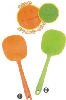
スマイルシリコンスプーン