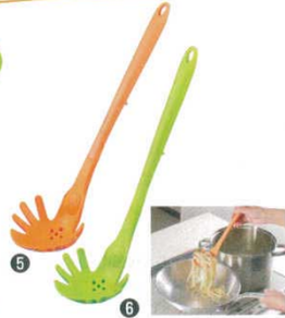
スマイルシリコンパスタサーバー

95×320 材質：すくい部/シリコン樹脂 耐熱220℃ ハンドル部/66ナイロン 耐熱180℃ 芯/ステンレス鋼 ●シリコン製なのでお鍋・フライパンの角にもピッタリとフィットしてきれいにすくえます。 ●小さじ(5cc)と大さじ(15cc)の計量目盛り付。