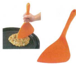
⑬ シリコンカッターナー