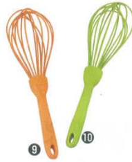
スマイルシリコン泡立て

全長：305 耐熱温度：230℃ 材質：本体/シリコン樹脂 耐熱230℃ 芯/ステンレス鋼 スプーン容量：約2cc ●ハンドル部がスプーン形状になっているので、ちょっとした味付けや味見に便利です。