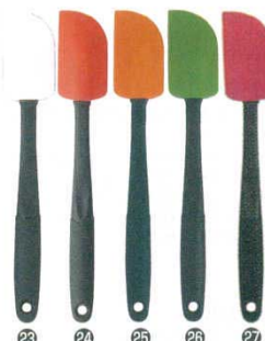
オクソ耐熱シリコンヘラ 中