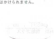
㉔ ディナープレート 4510800 φ255×H25