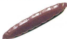
⑱ 小判皿 ブラウン 4511200 630×265×H40