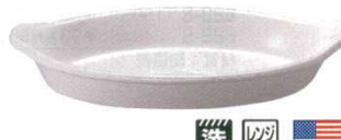
⑧ キャセロール オーバル 7400-02 マイクロウェーブウェア 外寸: φ220×130×H38 8045200 ②④ 容量: 340cc 材質: ポリカーボネイト製 耐熱温度: -40℃~100℃