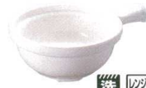
⑨ スूपボール 手付 7420-02 マイクロウェーブウェア 外寸: φ135×H60 8045300 ②④