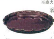
⑳ サービスペート 大 商品コード ㉒ ブラウン 4511300 ㉓ ホワイト 4508800 φ365×H40