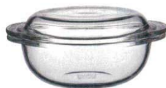
⑥ キャセロール 蓋 商品コード B682T 212×175×94 (H34) 3658100 B683T 240×200×100 (H34) 3658200