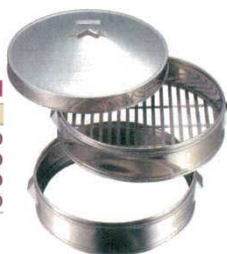
②中華セイロ ステンレス (メッシュ底) EBM