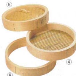
④中華セイロ 身 ひのき

外寸：370×400×H330 8873500 引出寸法：290×320×H10 一段あたりの有効高さ：H20 底径：φ550 ※60cmの中華鍋をご使用下さい。