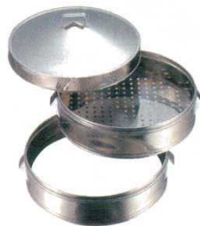
①中華セイロ ステンレス (パンチング底) EBM