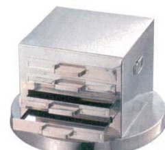
③中国スタイル引出し式 蒸器 ステンレス EBM

外寸：370×400×H330 8873500 引出寸法：290×320×H10 一段あたりの有効高さ：H20 底径：φ550 ※60cmの中華鍋をご使用下さい。