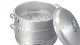
⑫特製セイロ アルマイト