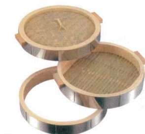
⑦中華セイロ ステンレス枠 18-0