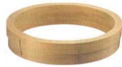
⑧料理鍋用中華セイロ 台輪

※身、蓋は27cm~45cm手ナシ48cm~60cmは手付です。 台輪は全サイズ手ナシです。 ※サイズは④、⑤、⑥と同じです。