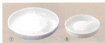
セラミックオロシ器 京セラ 商品コード