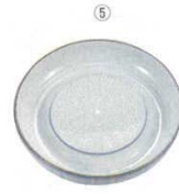
⑤ おろし器 セラミック 商品コード