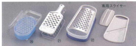
⑳ おろしケース 蓋付 PP 201×106×H85 8218500 110cc 材質：本体／PP 蓋・おろし部／スチロール樹脂 すべり止め／EVA樹脂