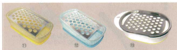
ザ・おろし 商品コード