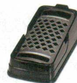
⑩ 楽楽オロシてみま専科 7815600 125×300×H85 おろし金サイズ：101×219（板厚1.5mm） 材質：おろし金／18-0ステンレス 受け皿：AS樹脂（耐熱温度80℃） 滑り止め：エラストマー樹脂（耐熱温度80℃） 水切り：ポリプロピレン（耐熱温度120℃） ●ひとつずつ鋭利な本目立てをしているので切れ味が良く、食材をすり潰すのではなく繊維を切っておろすので、食材を潰さずほどよく水分を含んだなめらかなおろしが作れます。