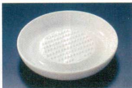
② セラミック鬼おろし ボーレックス φ180×H32 2007000 材質：磁器（すべり止め／シリコンゴム） ●シリコンのすべり止め付きで片手でおろせます。