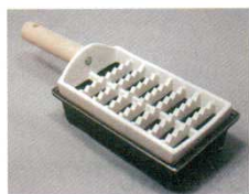
① 鬼おろしセット セラミック 受皿付 ONI-1-E 265×100×H85 2018200 ●有田焼の受け鉢付きなのでそのまま食卓に！