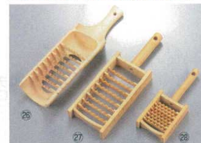
㉖ 大根おろし 29K-040 竹製 290×90 8604700