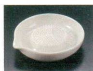
⑥ 薬味おろし器 セラミック φ97×H23 8008300 材質：磁器（すべり止め／シリコンゴム）