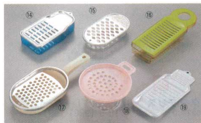
⑭ ベンリー卸器（容器付） 180×93×H38 5693300