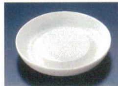
③ セラミックおろし ボーレックス 商品コード 大 φ180×H32 2010200 中 φ145×H28 2010300 小 φ107×H22 2010400 材質：磁器（すべり止め／シリコンゴム）