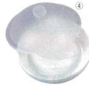
④ 大根おろし器 セラミック CD-25 φ178×H35 6711000 ●一時保存に便利な蓋付