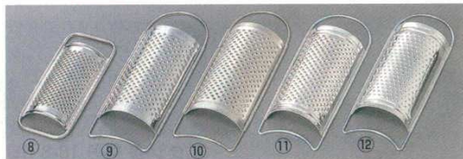
⑧ セミサークルグレーター(ダブル)

Stix 7358200 170×122×H260 材質：本体樹脂部 / ナイロン樹脂 刃部 / ステンレス鋼 ●細目刃・荒目刃付き ●本体底面に吸盤がついています。ベースレバーの操作により簡単に固定及び解除ができます。