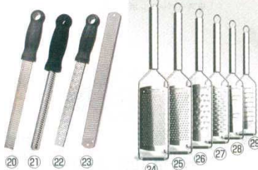
マイクロブレインクラシック

外寸 商品コード ⑳ ゼスター MP001 323×36 1690500 チース・チョコレート・柑橘類やしょうがなど目詰まりせずに卸せます。 ㉑ スパイス MP002 220×28 3571800 アーモンドやナツメグなど小さく硬い食材をパウダー状に仕上げます。 ㉒ ミディアムリボン MP003 323×36 3571900 チースやチョコレートをリボン状に卸せます。 ㉓ グレーター(ハンドルなし) MP004 323×33 3572000 チース・チョコレート・柑橘類やしょうがなど目詰まりせずに卸せます。 材質：刃 / スチール レーザー加工仕上 ハンドル / ポリプロピレン