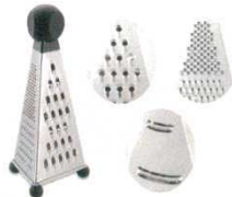
⑤ 3面チーズグレーダー

087-0725 3794800 ⑥ 100×H212 材質：金属部 / 18-0ステンレス鋼 樹脂部 / エストラマー樹脂 ABS樹脂