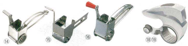
⑭ チーズグラインダー N3009X LT