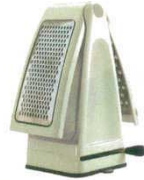
⑦ グレーター No.1009

商品コード 11 cm φ 60×H110 2023000 16.5cm φ 77×H150 2023100 21 cm φ 110×H210 2023200 25 cm φ 127×H250 2023300 材質：ステンレス