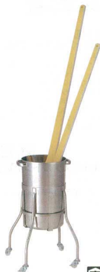
⑥スパテラ スタンド 18-8

8522900 容器：φ270×H400 全高：620 ●容器と脚台は取りはずしが出来、洗浄が簡単です。 ※スパテラは別売です。