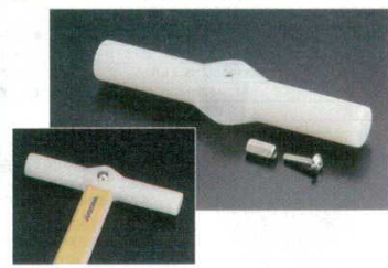
⑤ハイテックスパテラ用ハンドル