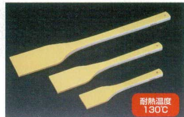
④ハイテック・スパテラ 角 (SPS) 抗菌 洗