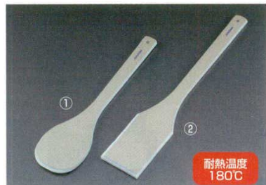
①ハイテック・スパテラ ハードタイプ丸 (SPOH) 抗菌 洗

従来の木製スパテラは欠ける・焦げる・ひび割れる、或いは削れることにより木片が食材に混入する恐れがあり、衛生管理上の最大の問題点でした。超高分子量ポリマーUMSP製を使用することによりそれを解消しました。さらに軽量です。