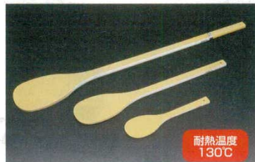
③ハイテック・スパテラ 丸 (SPO) 抗菌 洗

●今までのハイテックスパテラでは出来なかったカレーのルー作りや高長時間でのデミグラスソース等の攪拌も可能になりました！