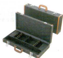
⑬ 庖丁ケース Y-02A 和食用 Wカラー 8丁入 外寸: 570×280×H100 6393400