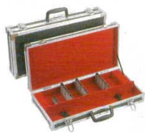
⑥ ナイフケース AH-1 大 ハードタイプ 黒 スペシャルグレード 5429500 10丁入 外寸: 570×285×H100 小物収納スペース: 550×90×H50 材質: ジュラルミン製