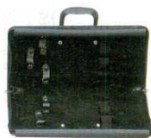
⑱ 庖丁ケース 学校用 5丁入ケース 外寸: 443×195×H30 8119500