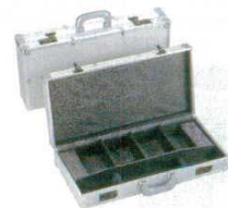
⑩ 庖丁ケース 洋食用 アルミ製 10丁入 外寸: 570×280×H90 5836900