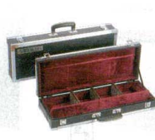
④ 庖丁ケース 中 グレスデン 8丁入 外寸: 570×215×H95 3517400