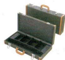
⑭ 庖丁ケース Y-02B 洋食用 Wカラー 10丁入 外寸: 570×280×H100 6393500