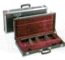
③ 庖丁ケース 大 グレスデン 11丁入 外寸: 570×280×H90 0611800