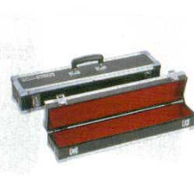
⑤ 庖丁ケース 小 グレスデン 3517500 仕切りナシ 外寸: 570×125×H95 内寸: 540×95×H81 ※②の庖丁巻などと組み合わせでの使用をおすすめします。