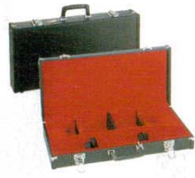
② 庖丁ケース 和食用 (レザー張) 7丁入 外寸: 575×280×H85 0611600