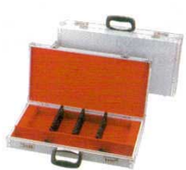
⑫ 庖丁ケース ダイアル式 (洋食用) ジュラルミン製 14丁入 外寸: 565×275×H95 0612000