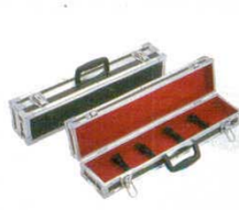
⑧ ナイフケース AH-3 小 ハードタイプ 黒 スペシャルグレード 5429600 フリー 外寸: 570×125×H100 内寸: 550×108×H75 ※②の庖丁巻などと組み合わせでの使用をおすすめします。