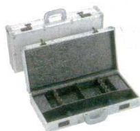
⑪ 庖丁ケース 和食用 アルミ製 8丁入 外寸: 570×280×H90 5836800