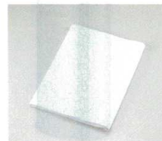
㉑ さらし(吉田晒)EBM 幅34cm×10m巻 3076500 材質: 綿100% ●多種多様に使えます。