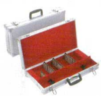
⑦ ナイフケース AH-1 大 シルバー スペシャルグレード 5429700 10丁入 外寸: 570×285×H100 小物収納スペース: 550×90×H50 材質: ジュラルミン製