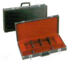
① 庖丁ケース 洋食用 (レザー張) 8丁入 外寸: 575×280×H85 0611700

ストック・裏漙し・スリッパ類 オープンウエア・デリカフレート類 蒸し器・セイロ類 和食・寿司・おにぎり・抜型類 庖丁・砥石類 給食道具・ストレーナー類 バスボックス類 薬味入・シリルウエア容器 ボール・ザル・水ます はかり・タイマー