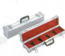
⑨ ナイフケース AH-3 小 シルバー スペシャルグレード 5429800 フリー 外寸: 570×125×H100 内寸: 550×108×H75 材質: ジュラルミン製 ※②の庖丁巻などと組み合わせでの使用をおすすめします。