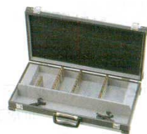
⑮ 庖丁ケース AH-5 洋食用 スタンダード 10丁入 外寸: 575×290×H90 6943600 表面: 塩ビシート 内側: メルトン張