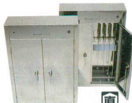
⑥ 庖丁殺菌庫 殺菌灯付き 電気式 18-8 CS-G10 6393300

500×210×H700 単相100V / 10W ●刃渡36cmまでの庖丁が10本まで収納できます。 ※カギ付。