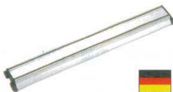
⑫ ナイフホルダー マグネット式 アルミ製 ドライザック