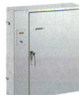
⑦ 殺菌灯付庖丁庫8本差 DSC-8P 3434400

500×210×H700 単相100V / 10W ●刃渡36cmまでの庖丁が10本まで収納できます。 ※カギ付。