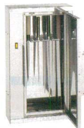
⑨ 壁掛式庖丁消毒器キンキラ K-104 1095600

450×160×H580 単相100V / 10W ●刃渡33cmまでの庖丁が7本まで収納できます。