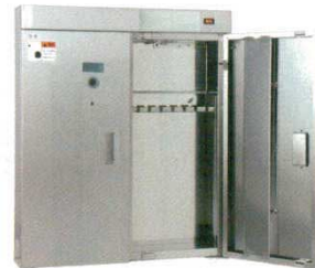
③ 庖丁殺菌庫C-15A アスバルキントール電気式 7335110