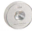
⑭ ラウンドマグネットナイフラック (0003-077) 3794600