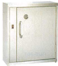
④ 庖丁殺菌庫 殺菌灯付き 電気式 K10S型 4235200

●光触媒と強力殺菌ランプのW効果 ●ワンランク大きいサイズ(刃長390)の庖丁が収納できます