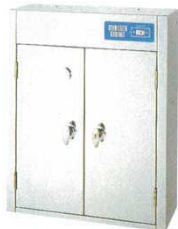
① 庖丁殺菌庫 電気式