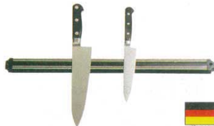
⑪ ナイフホルダー マグネット式 PC製 ドライザック

大 TKS01 240×90×H265 刃渡240 3779800 小 TKS02 207×75×H220 刃渡210 3779900 材質:竹集成材、アクリル ●マグネットにより、庖丁をしっかり固定し収納出来ます。