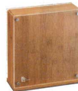
⑩ 庖丁差し マグネット式 竹製

330×130×H572 単相100V / 13W ●刃渡36cmまでの庖丁が4本とその間に小ナイフが3本収納できます。