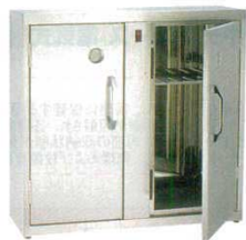
② 庖丁殺菌庫 殺菌灯付き 電気式