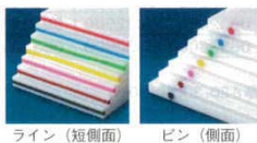
ライン(短側面) ピン(側面)