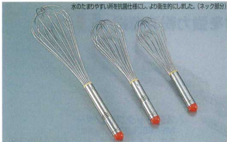
① 泡立 18-8 EBM