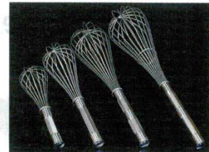
③ 泡立 耐熱防水 18-8