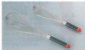
⑤ 泡立 18-8 SW