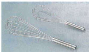
④ 泡立 共柄 18-8

※54cm以上は補強リング付きです。 ※すべてオール18-8ステンレス製で煮沸消毒OK。しかも完全防水。