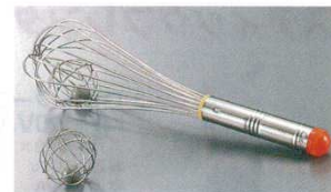
⑦ 泡立ボール セラマイルド 18-8 (セラミック製)

φ48 7336200 ●泡立の中に入れて使う事により、よりスピーディーに極めて細かい泡を立てる事が出来ます。 ※①の泡立EBM#9～#12に最適です。 ※写真の泡立は別売です。