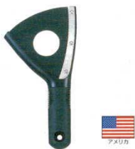
⑳オクソ ビンオープナー 68529 2232300

全長：240 材質：ハンドル/サントプレーン®ゴムヘッド/ABS・ステンレス ※どんなサイズのフタにも合う、ピン開け器。