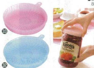
シリコンピンオープナー

163×155 (厚み8mm) 耐熱温度：220℃ 耐冷温度：-50℃ ●鍋敷きに。 ●びんの蓋開け。