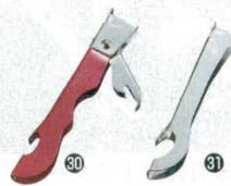
⑳ダイコク 三徳缶切 全長：125 0741200

材質：シリコン 耐熱：100℃ ●直径10cm以下なら、色々なサイズのピンのフタも滑りにくく、簡単に開けられます。