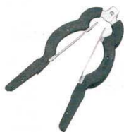
㉑ジャーオープナー KT-09 8040300

全長：240 材質：ハンドル/サントプレーン®ゴムヘッド/ABS・ステンレス ※どんなサイズのフタにも合う、ピン開け器。