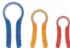
㉓びん蓋開け (3サイズセット) AL-90 0289500

全長：195 材質：体/ABS樹脂 滑り止め部/合成ゴム 耐熱温度：70℃ ●缶詰、びん詰、缶ジュース、ペットボトルまで。これ1本でOKの「らくらくオープナー」