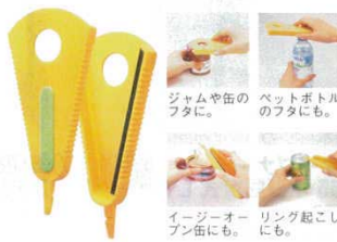
㉒Gプラス らくらくオープナー K-100 0342400

全長：195 材質：体/ABS樹脂 滑り止め部/合成ゴム 耐熱温度：70℃ ●缶詰、びん詰、缶ジュース、ペットボトルまで。これ1本でOKの「らくらくオープナー」