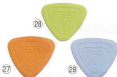
シリコングリップ

195×167 (厚み7mm) ●鍋敷き、鍋つかみ、びんの蓋開け、作業をする際の滑り止めと色々な使い方ができます。 ●マグネットが埋め込んであり、使わないときは冷蔵庫などに貼り付けておくことができます。