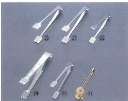
レモントング 厚手 ②④ 全長 商品コード ②⑥18-8 120 0708000 ②⑦18-0 115 0707900 ②⑧ レモントング 18-0 T 全長：95 0707800 ②④ ヤクミトング 抗菌ステンレス 抗腐 全長 商品コード ②⑨大 128 6298800 ③⑩小 98 6298900 ③① レモントング コラム 全長：85 3530100