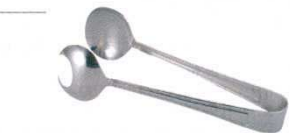
㉓ パンケットトング(S) 18-0 UK 全長：225 8012700