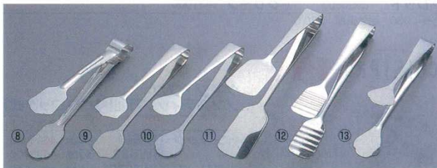
⑧ サービスケーキトング 抗菌 抗腐 全長：193 6581100 ⑨ ケーキトング 18-8 TH ②④ 全長：180 0705200 ⑩ ケーキトング 厚手 18-0 TH ②④ 全長 商品コード 全長 商品コード 大 180 0704900 中 140 0705000 小 120 0705100 ※18-0 ⑪ フレッシュケーキトング 18-0 ZY 全長：232 8227600 ケーキトング 18-0 T ②④ 全長 商品コード ⑫特大 215 0704300 ⑬大 188 0704400 中 145 0704500 小 115 0704600