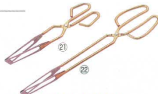
⑳ ケーキ用トング 39161 全長：250 2906900 材質：ハンドル/アルミ金メッキ 刃/ステンレス ㉑ 料理用トング 39163 全長：360 2907000 材質：ハンドル部/アルミ 刃/18-0ステンレス