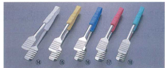
ケーキトング PP柄 抗菌 抗腐 全長：250 材質：先金 / 18-8 商品コード ⑭ホワイト 8113300 ⑮イエロー 8113400 ⑯ブルー 8113500 ⑰ピンク 8113600 ⑱グリーン 8113700