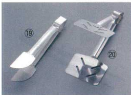
⑲ デバイヤー サービストング 18-10 フランス 全長：240 2141-00 1186600 ⑳ デバイヤー ハンバーグトング 18-10 フランス 全長：240 2142-00 1192100