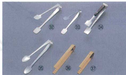
③② シュガートング 厚手 ②④ 全長 商品コード 大18-8 115 0707400 小18-8 90 0707500 大18-0 115 0707200 小18-0 90 0707300 ③③ シュガートング 18-0 T ②④ 全長：95 0707100 ③④ シュガートング 木柄 18-8 全長：115 0707700 ②④ ③⑤ シュガートング スコップ型 18-0 TH 全長：115 0707600 ②④ ミニトング 竹製 全長 商品コード ③⑥26-204 大 100 4255600 ③⑦26-203 小 70 4255500