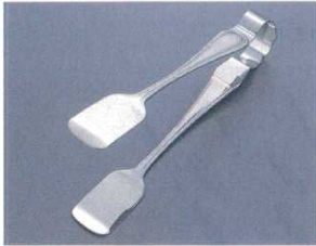
① パントング セシリア18-8 EBM 全長：215×35 6426900

※バネ材を使用していますので耐久性があり元に戻らなくなったりする心配がありません。