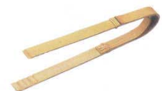
③⑧ 曲トング 竹製 全長 商品コード 大 215 5852100 小 180 5852200