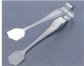
② ケーキトング セシリア18-8 EBM 全長：200 6427000