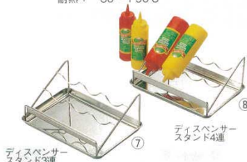
ディスペンサースタンド 18-8 EBM