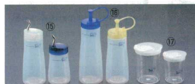
⑮ブルー ディスペンサー 10

(105cc) 87×40×H100 材質：本体/AS樹脂 フタ/ポリプロピレン ●一振り約4gの分量が出せます。