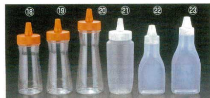
ドレッシングボトル ネジキャップ式 (蜂トンガリキャップ仕様)