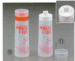
マジックファイブディスペンサー